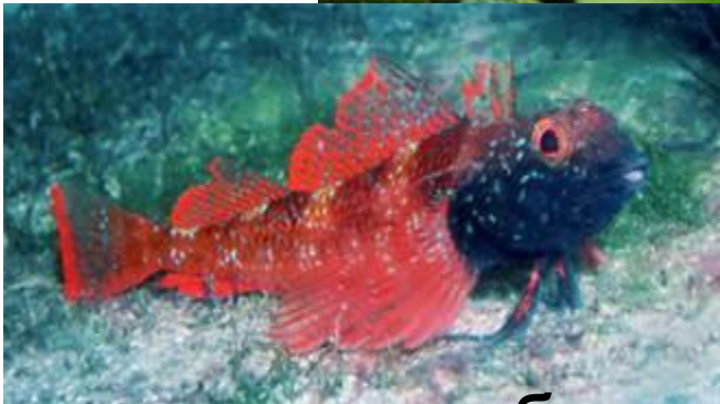
Самая яркая рыба Чёрного моря – троепер

А на огромной глубине, куда добираются только водолазы, обитают морские лисицы (скаты) и морские петухи.