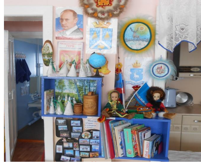
Центр «Юный исследователь»