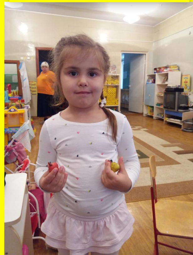
Лепка «Веселый огород»