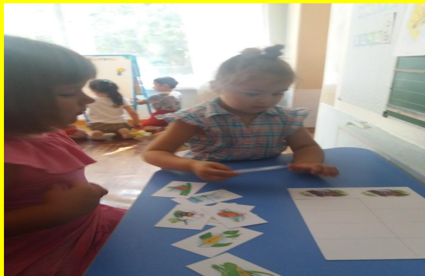
Наши маленькие друзья