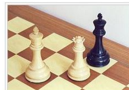
Белые фигуры сделаны из самшита

По прочности самшит превышает граб : на сжатие вдоль волокон — около 74 \text{ МПа} , при статическом изгибе — 115 \text{ МПа} .