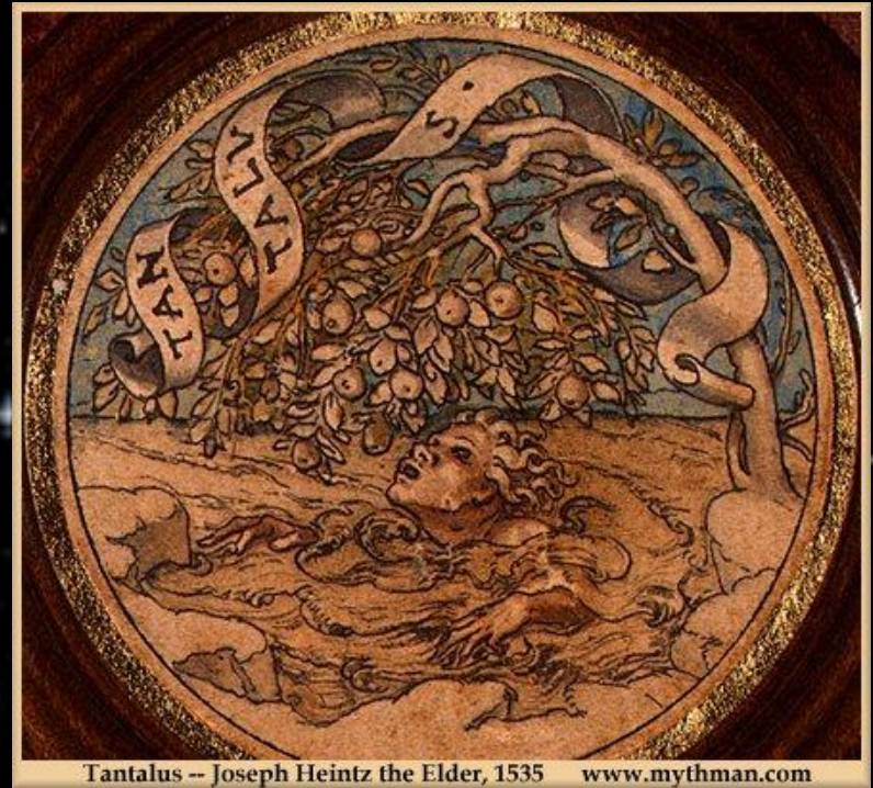
Tantalus -- Joseph Heintz the Elder, 1535 www.mythman.com

О человеке, который перенес лишения и муки, часто говорят: «Он претерпел танталовы муки».