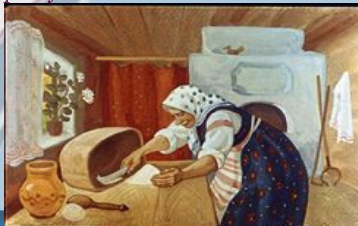
Взяла старуха крылышко, по коробу поскребла, по сусеку помела и наскребла муки горсти две.