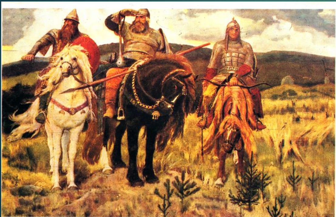
В. М. Васнецов "Богатыри" /1887/.

Народное предание гласит, что родная земля может накормить человека своим хлебом, напоить водой из своих родников, но защитить сама себя она не может. Это святое дело тех, кто ест хлеб родной земли, пьёт её воду, дышит её воздухом и проникается её красотой. Вот почему профессия воина, защитника Отечества всегда была, есть и будет почётной в нашей стране.