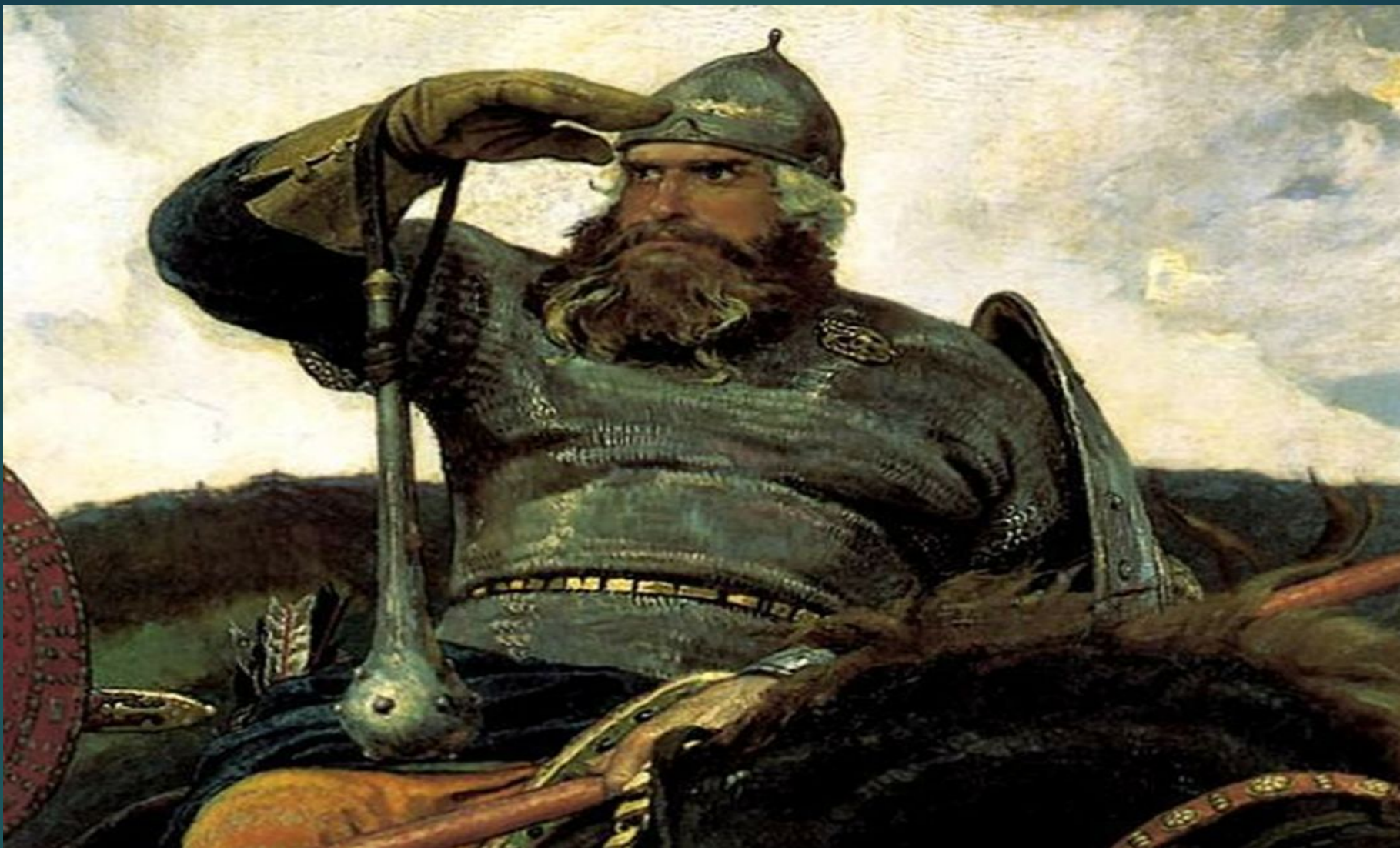
Илья Муромец – покровитель российских пограничников