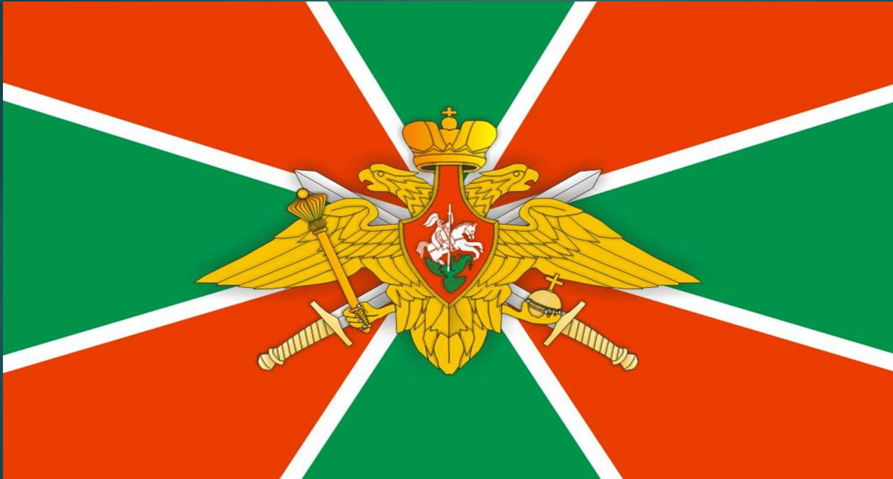
Флаг пограничной службы Российской Федерации