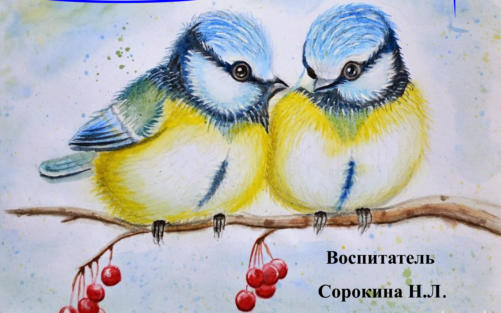
Фото-отчёт по проекту «Птички – синички»