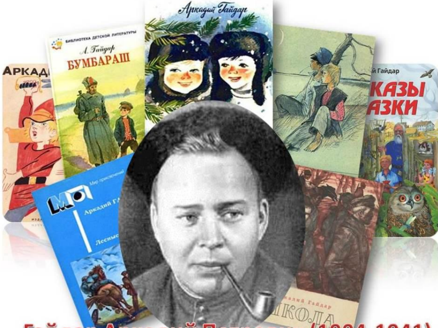
Гайдар Аркадий Петрович (1904-1941)