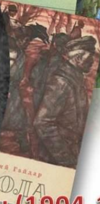
Гайдар Аркадий Петрович (1904-1941)