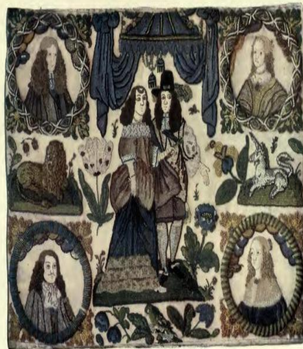
PLATE XXI— BEADWORK EMBROIDERY. CHARLES II. AND HIS QUEEN, ETC.