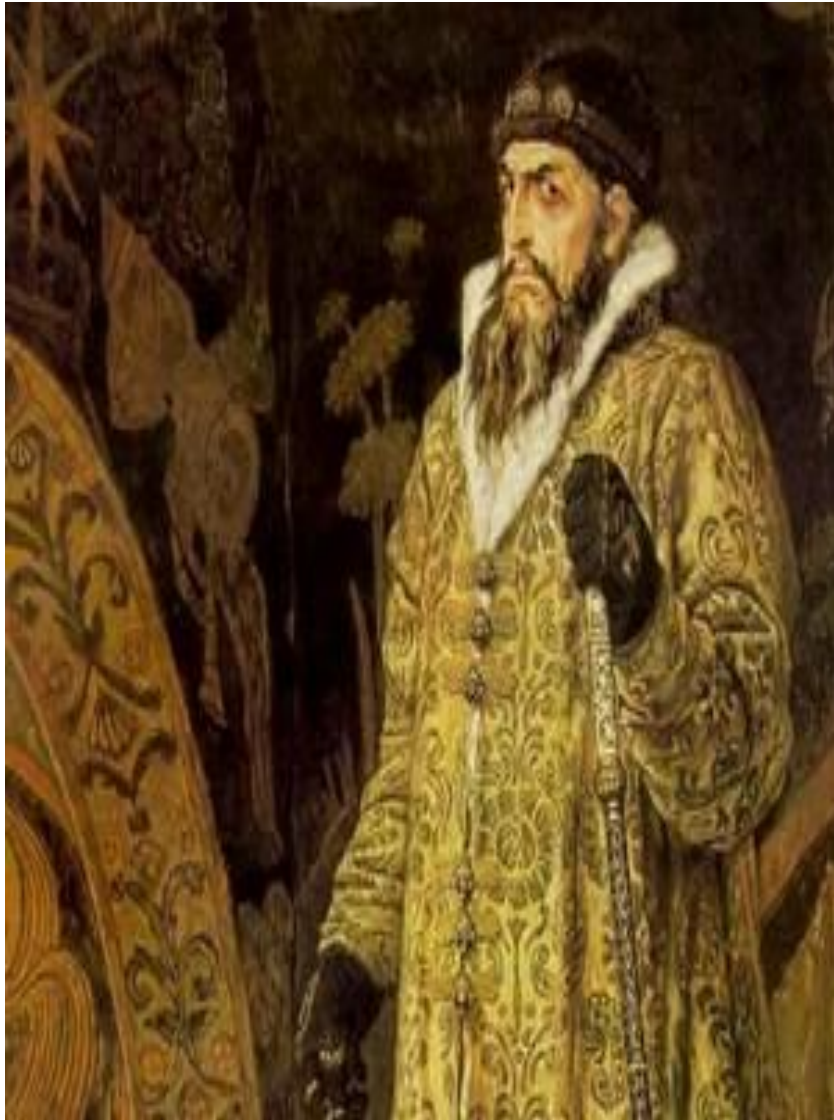
Царь Иван Васильевич 1897 Грозный