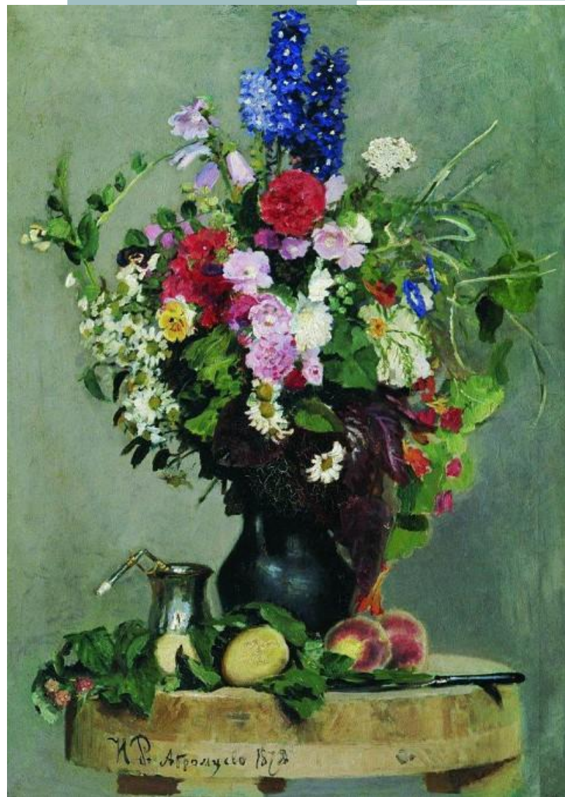
Букет цветов. 1878