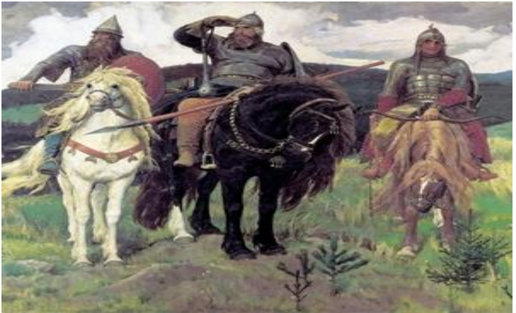
Три богатыря 1898