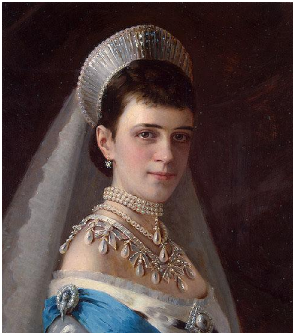
Портрет императрицы Марии Федоровны