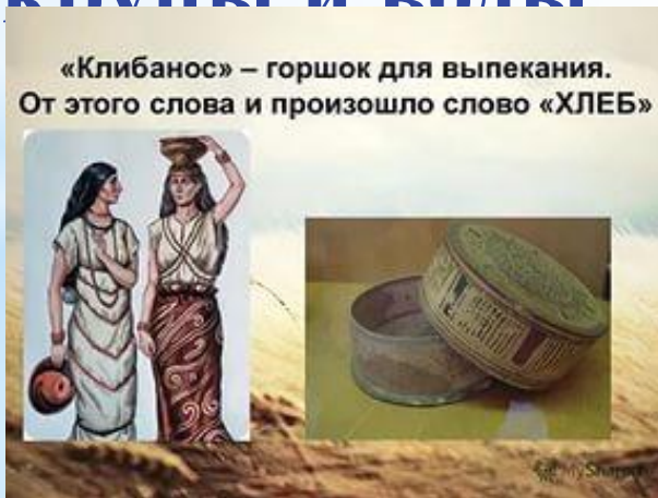
Первый печеный хлеб

Ученые полагают, что хлебу свыше 15 тысяч лет. Хлеб в те давние времена мало чем напоминал нынешний. Первый хлеб был похож на кашицу, приготовленную из крупы и воды