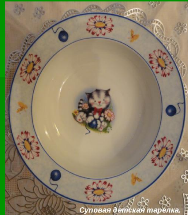
Суповая детская тарелка.