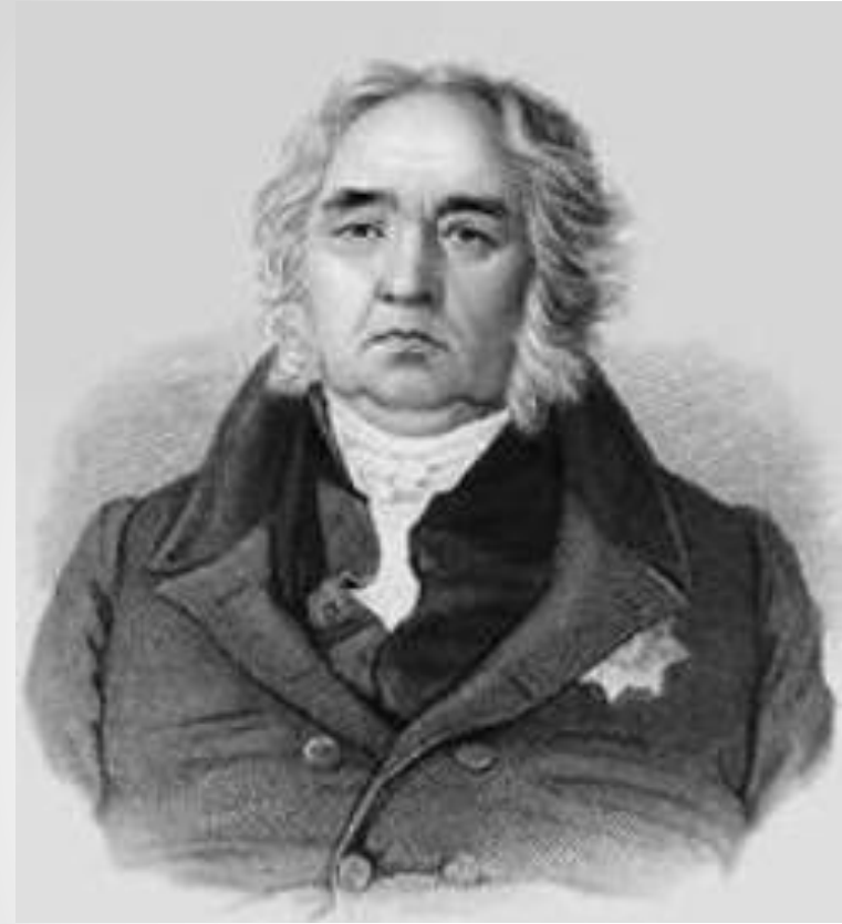
Иван Андреевич Крылов

Корчит рожи зверь- кривляка, Передразнивает всех. В цирке или зоопарке Обеспечен ей успех!