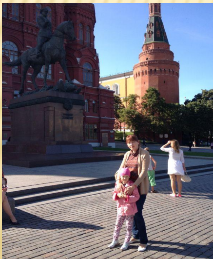
г. Москва, памятник маршалу Г.К. Жукову