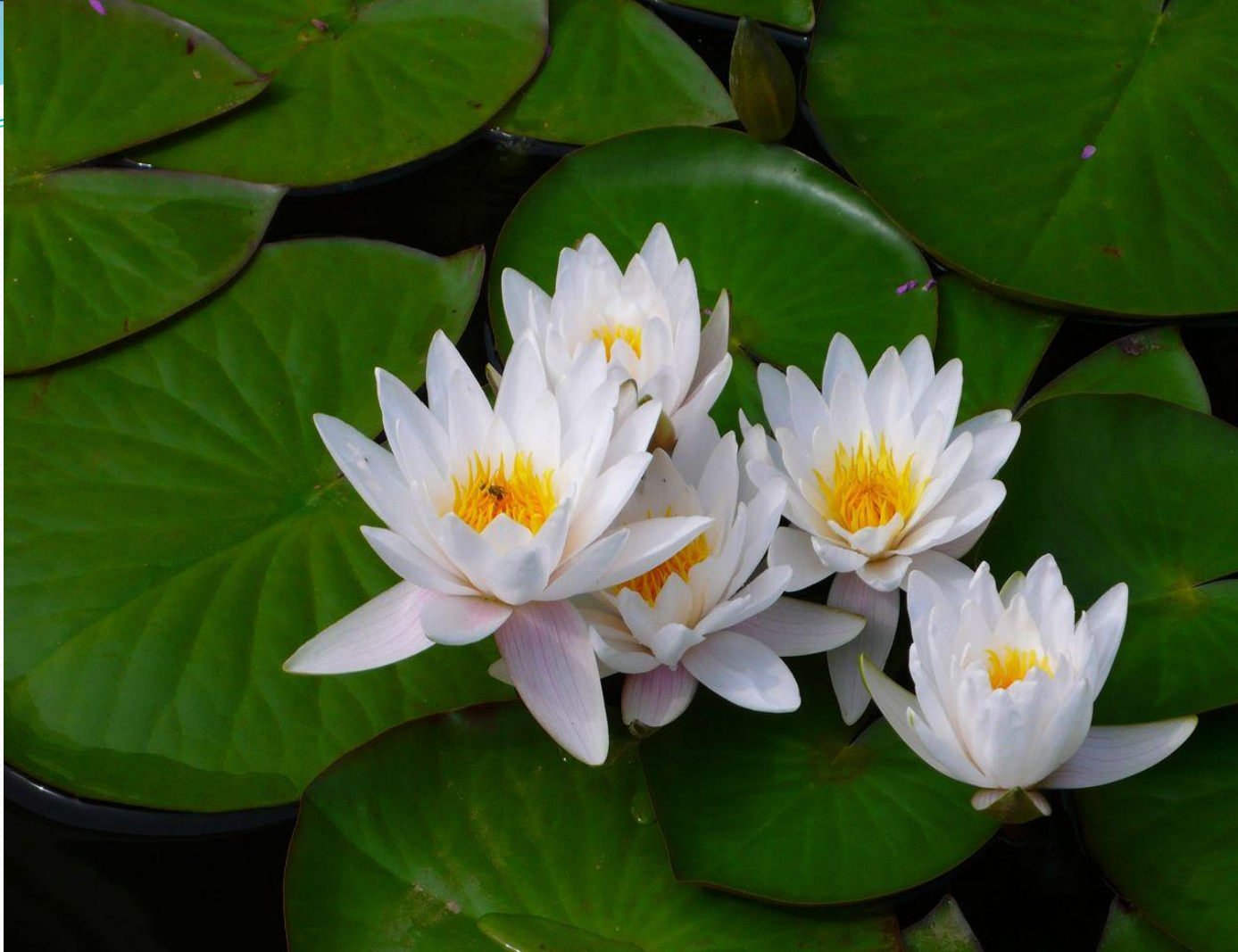
КУВШИНКА 8 часов – 19 часов