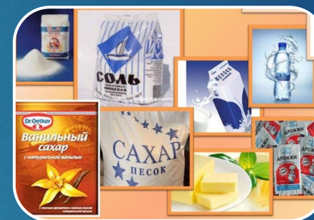
Ингредиенты для выпекания