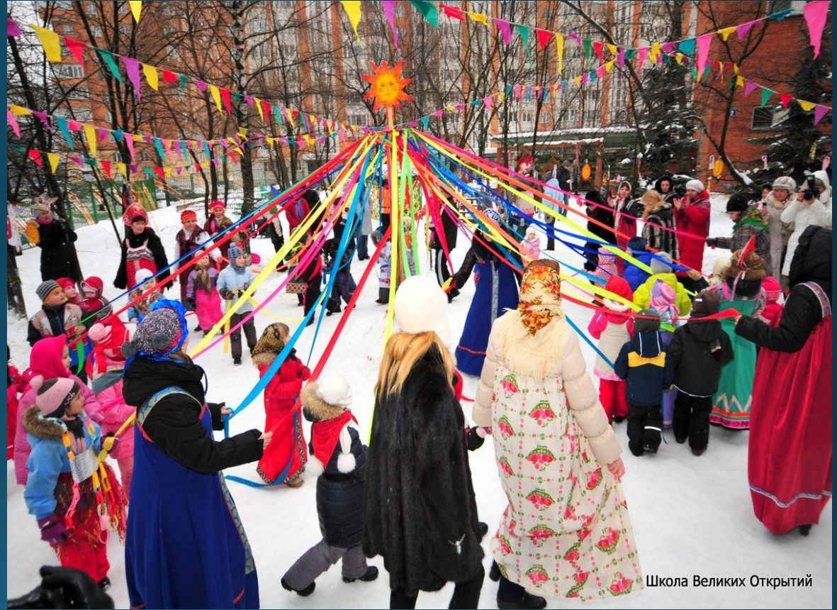
Школа Великих Открытий