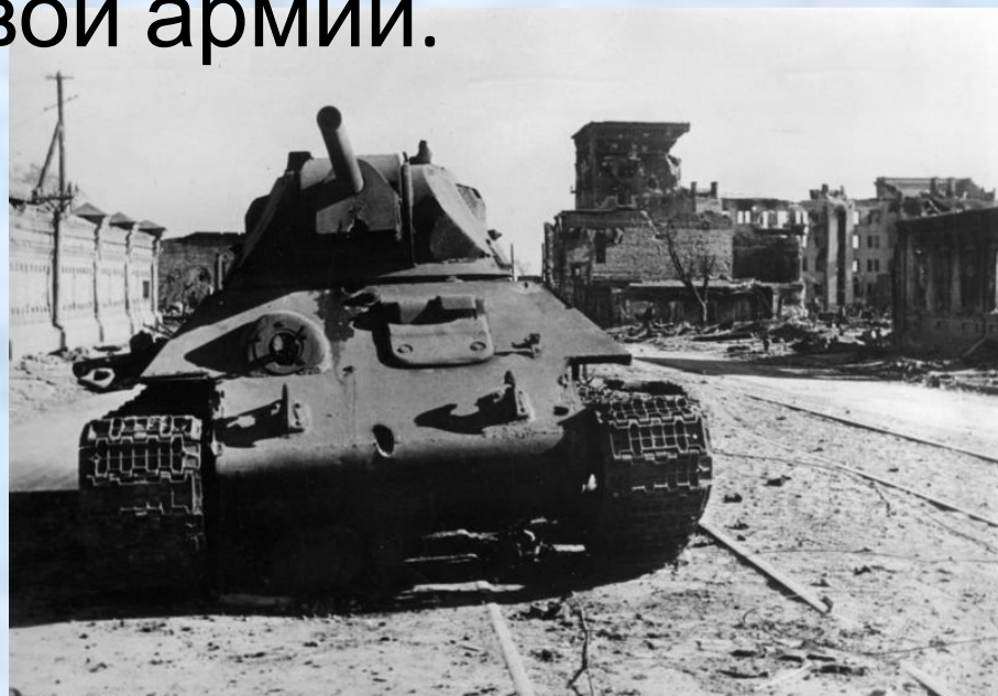
Bundesarchiv, Bild 183-B22359 Foto: Herber | Oktober 1942