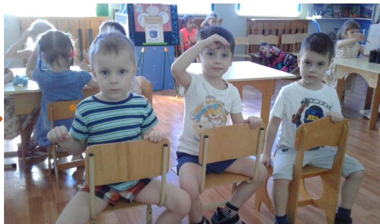
В. М. Васнецов «Три богатыря»