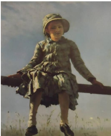
И. Репин «Стрекоза»