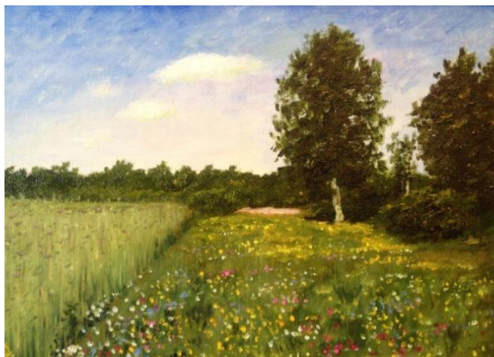
И. И. Левитан «Июньский день»