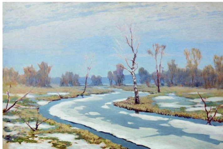
А. И. Куинджи «Ранняя весна»