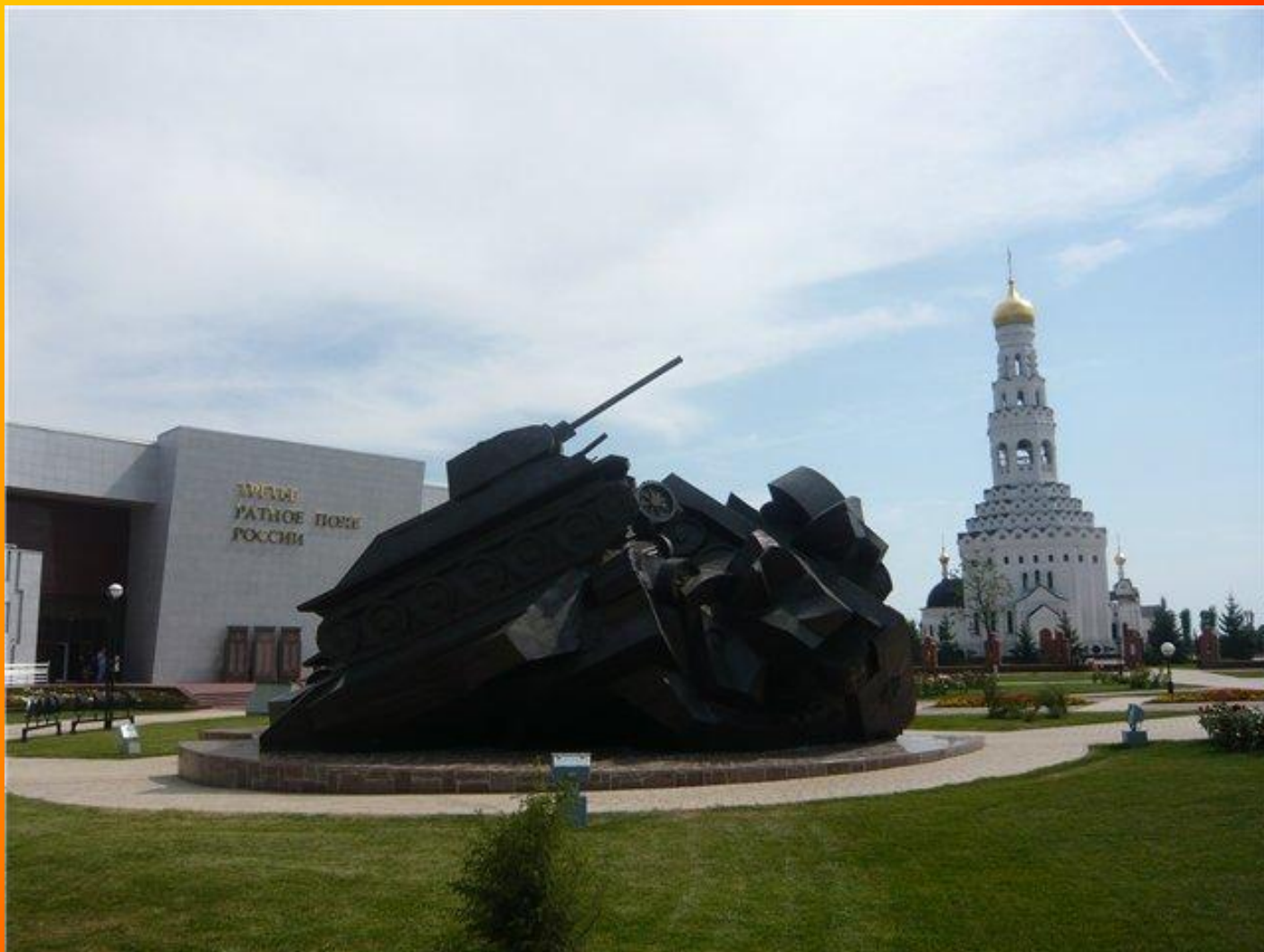
Достопримечательности города героя Курска.