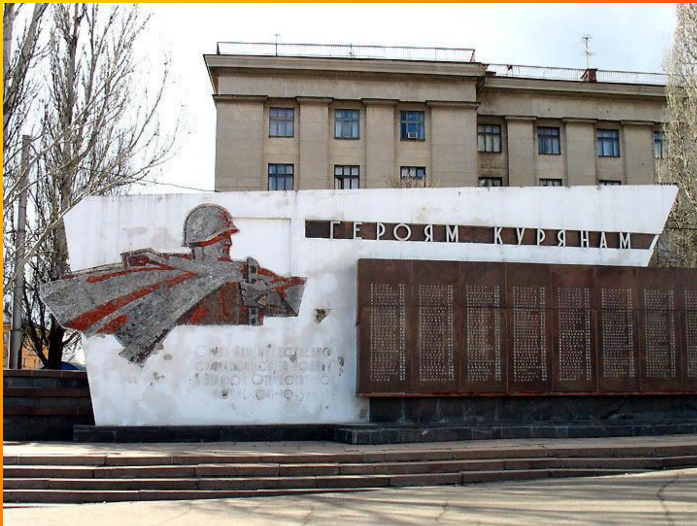
Мемориал - Стелла - Героям-курсянам в городе Курск.