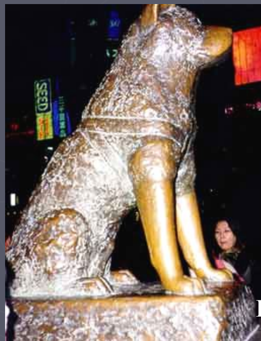
Берлинский памятник собакам-поводырям