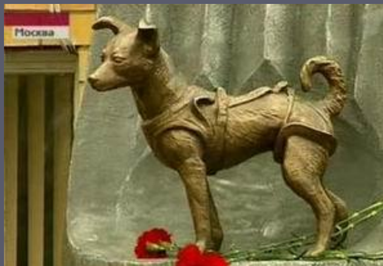
Памятник собаке Лайке, которая стала первым космонавтом