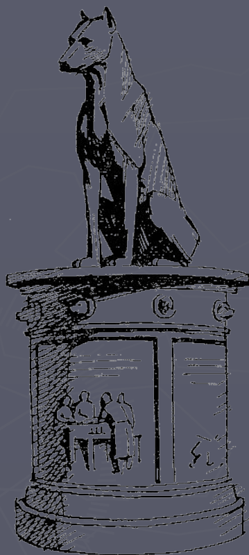
Памятник собаке, установленный в Ленинграде