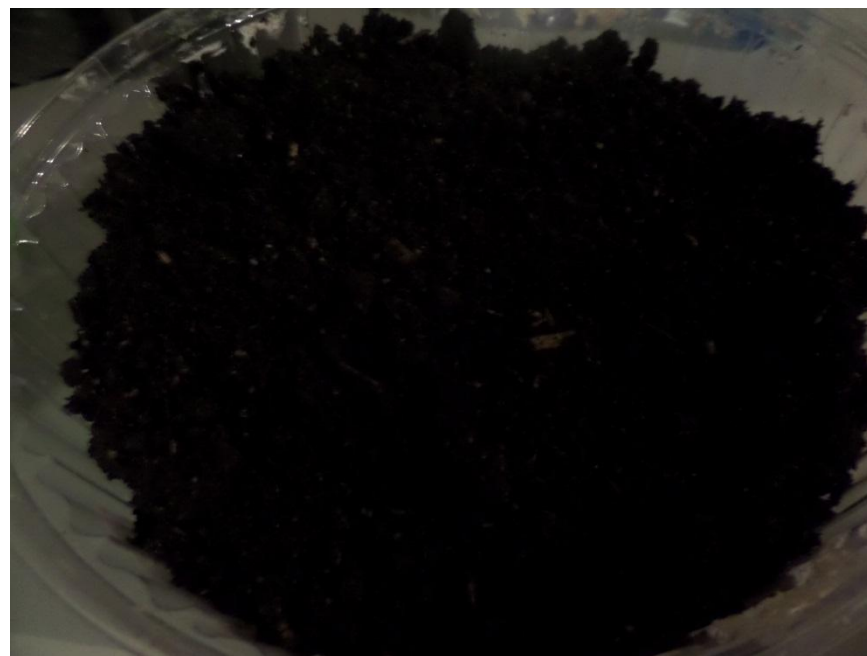
19 ноября посеяли семена в грунт