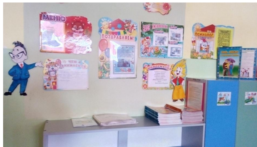
Выставка творческих работ для родителей