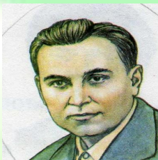
Сухомлинський Василь Олександрович