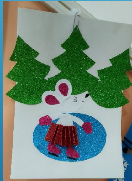
Выставка поделок «Новогодний калейдоскоп»