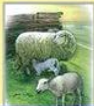
Разведение мелкого рогатого скота (овцеводство)