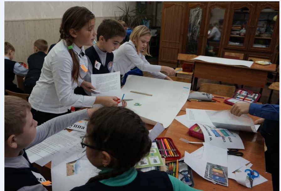
Работа над проектом