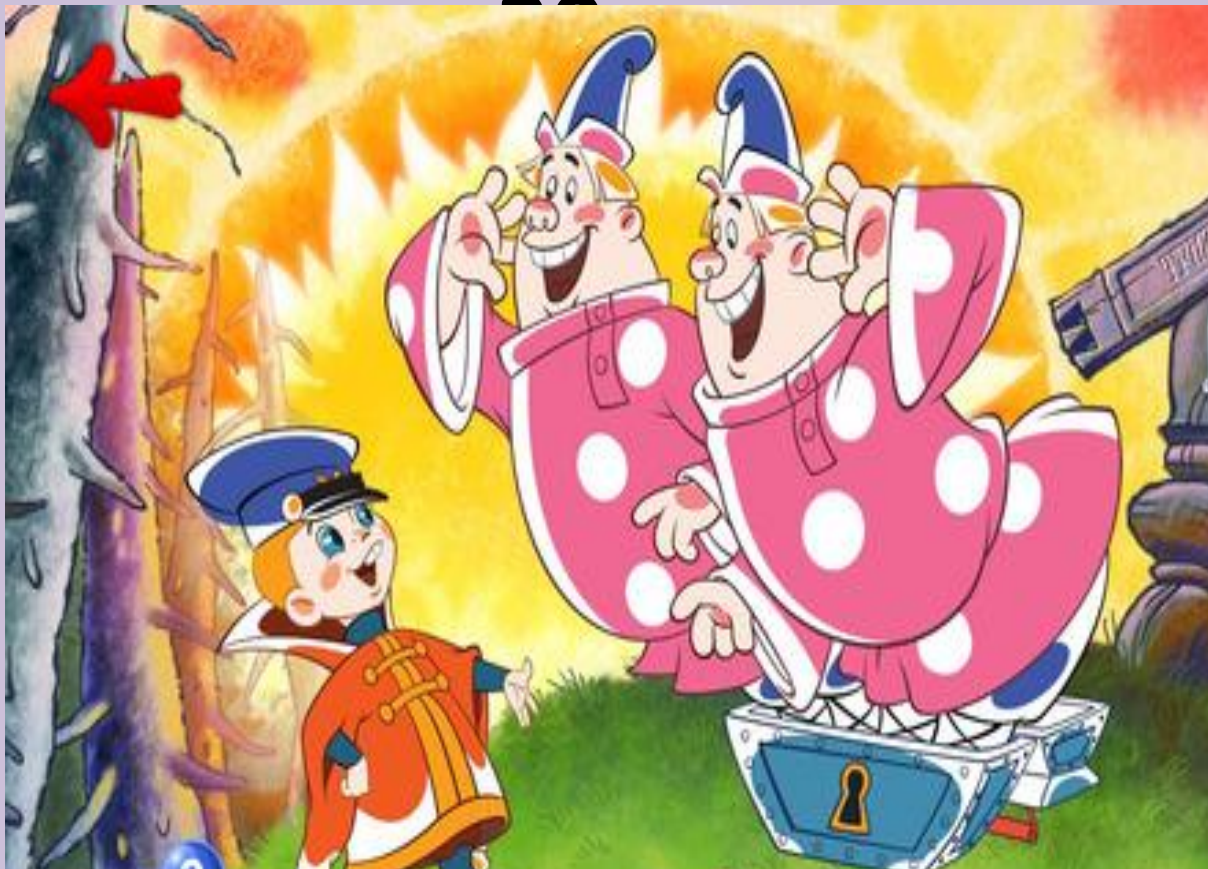
Таблица умножения в пределах