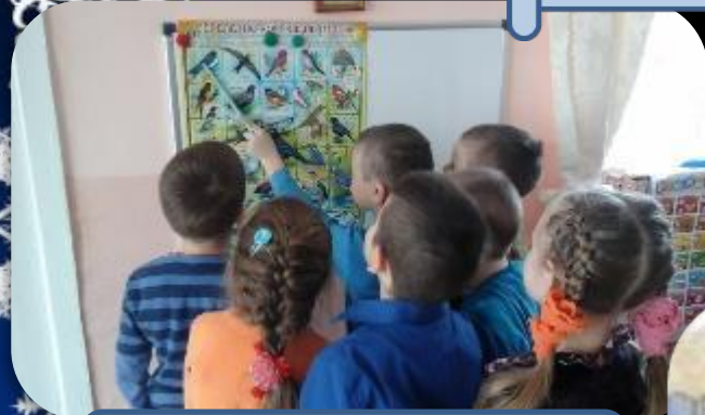
Изучаем птиц родного края