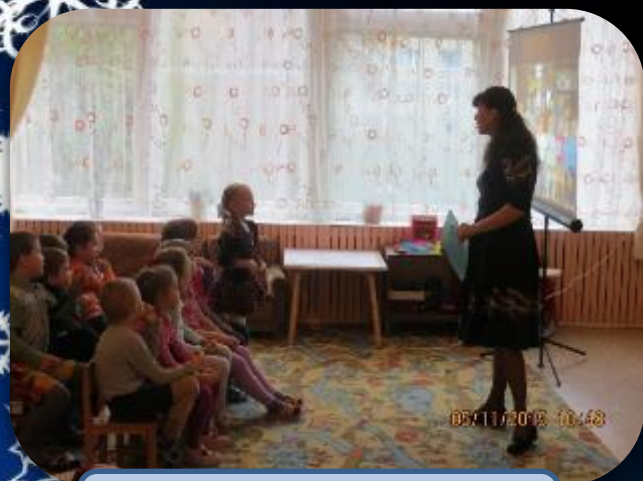
Занятие «Зимующие и перелетные птицы»