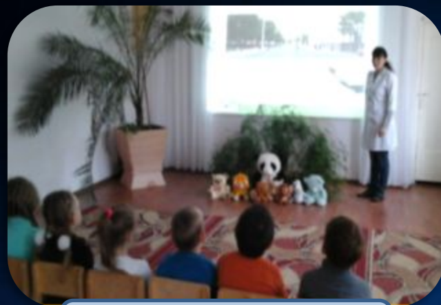
Занятие «Красная книга»