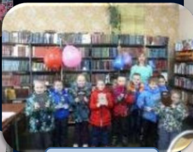
Экскурсия в детскую библиотеку