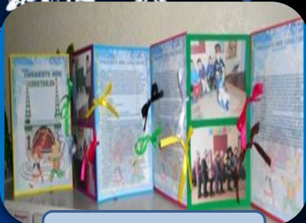
Книжка –передвижка «Эти прекрасные птицы»