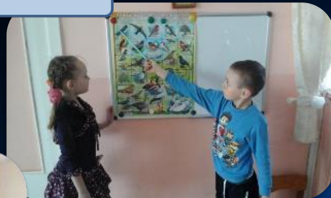
Изучаем птиц родного края