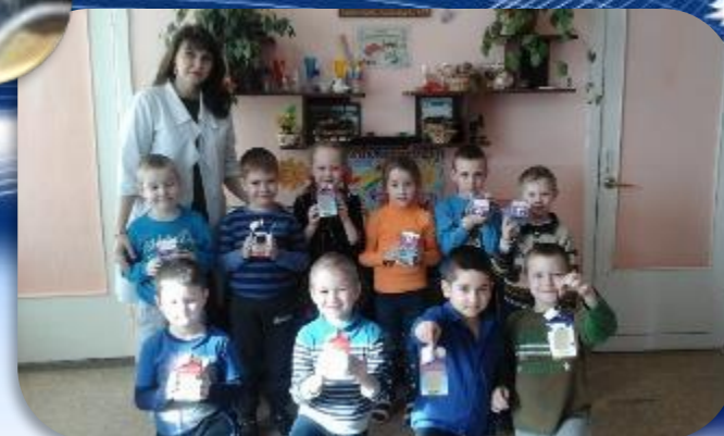
Изготавливаем кормушки для птиц