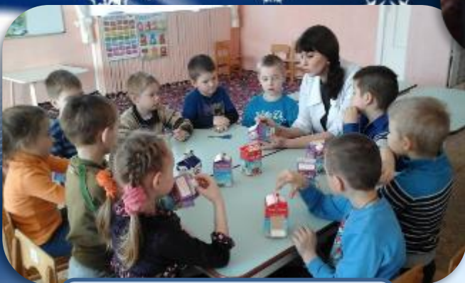
Изготавливаем кормушки для птиц