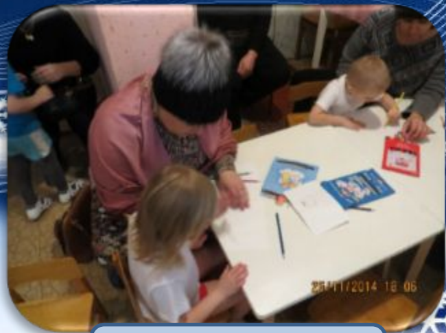
Досуг «Нарисуем птичке дом»