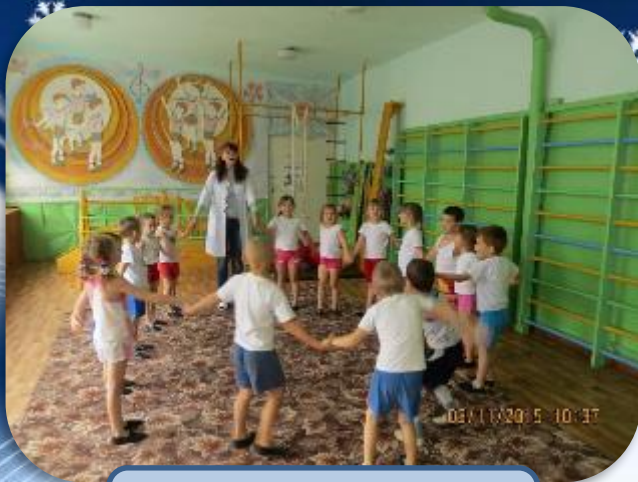
Досуг «Узнай птицу»