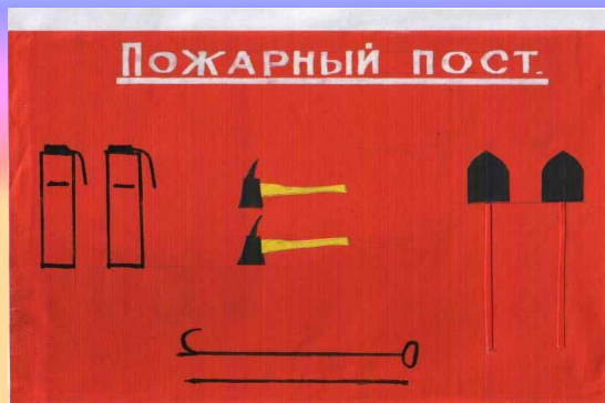
«Пожарный пост» семья Киселёвых