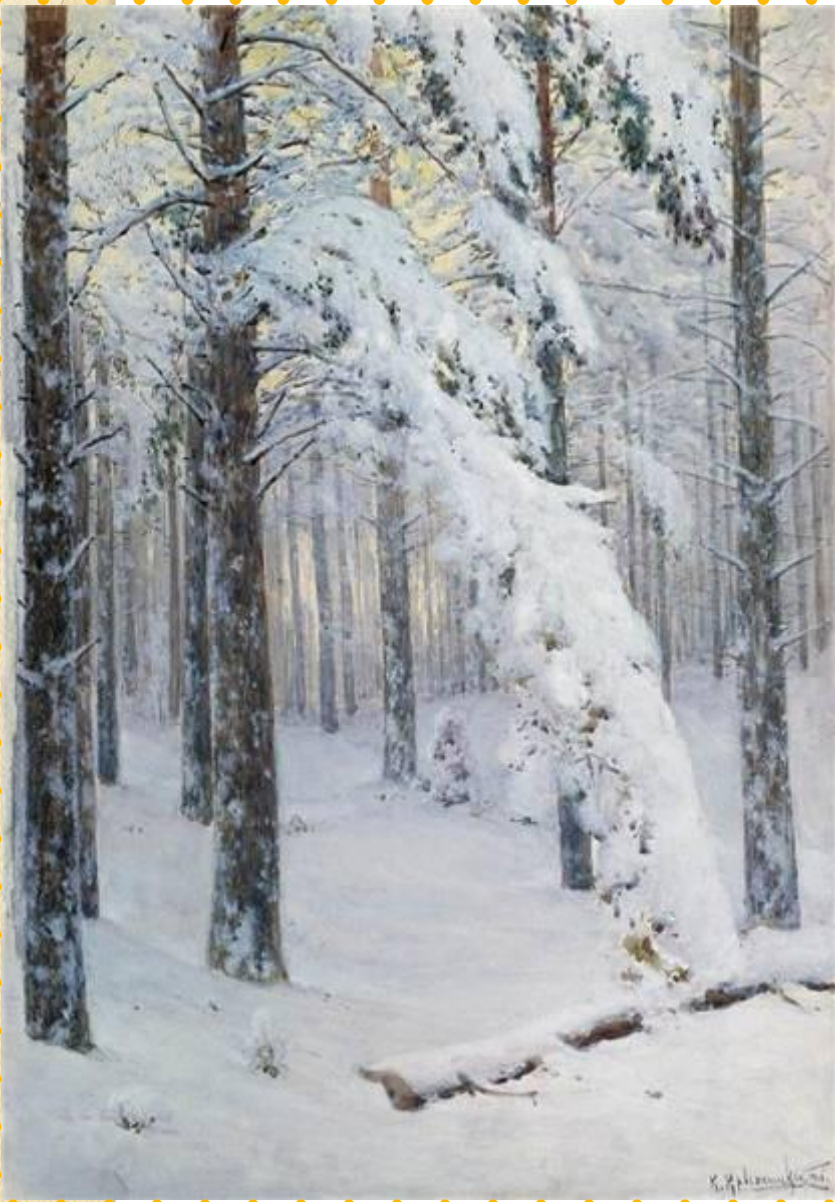
К. Я. Крыжицкий. «Лес зимой».