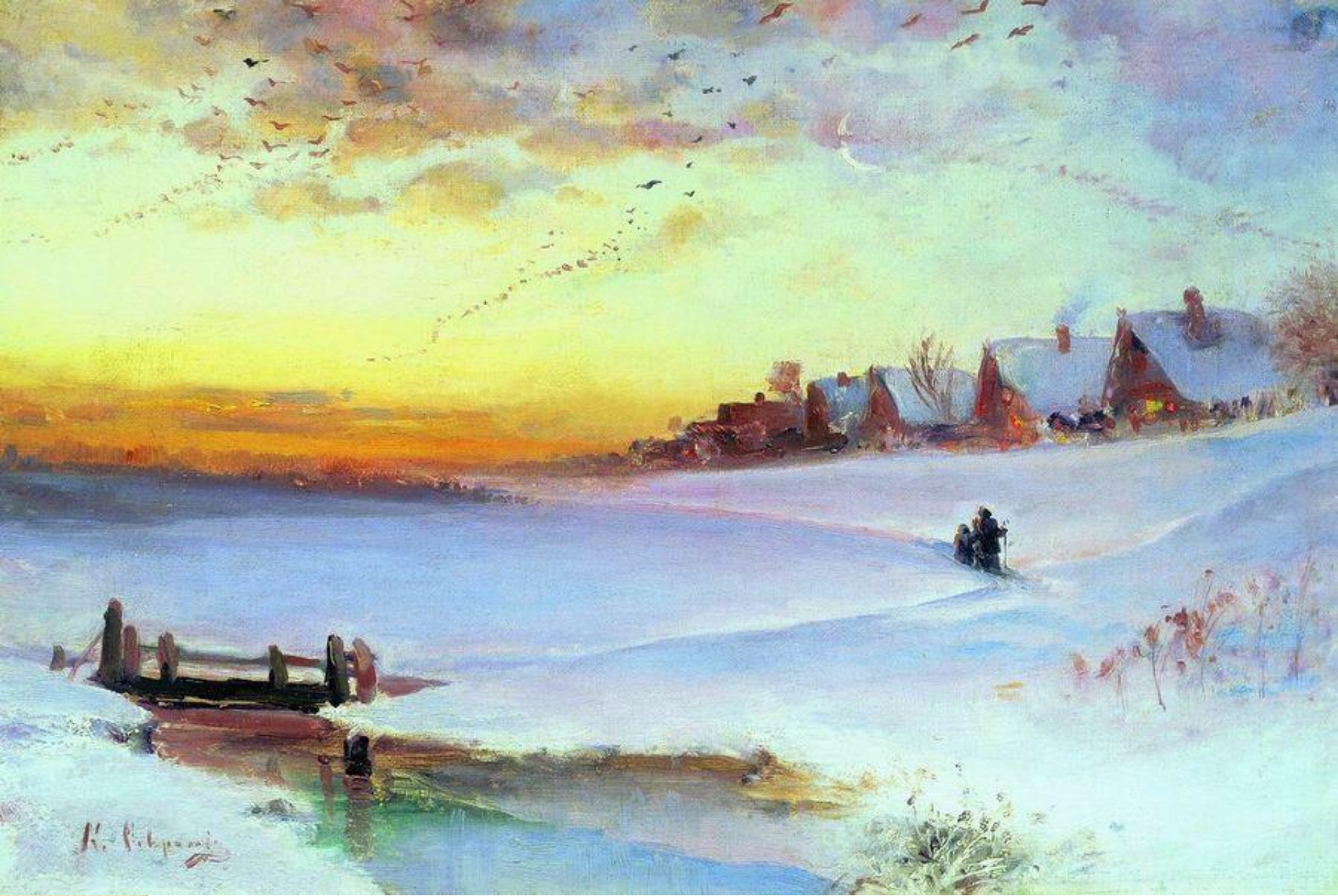
Саврасов А. К. Зимний пейзаж (Оттепель). 1890-е