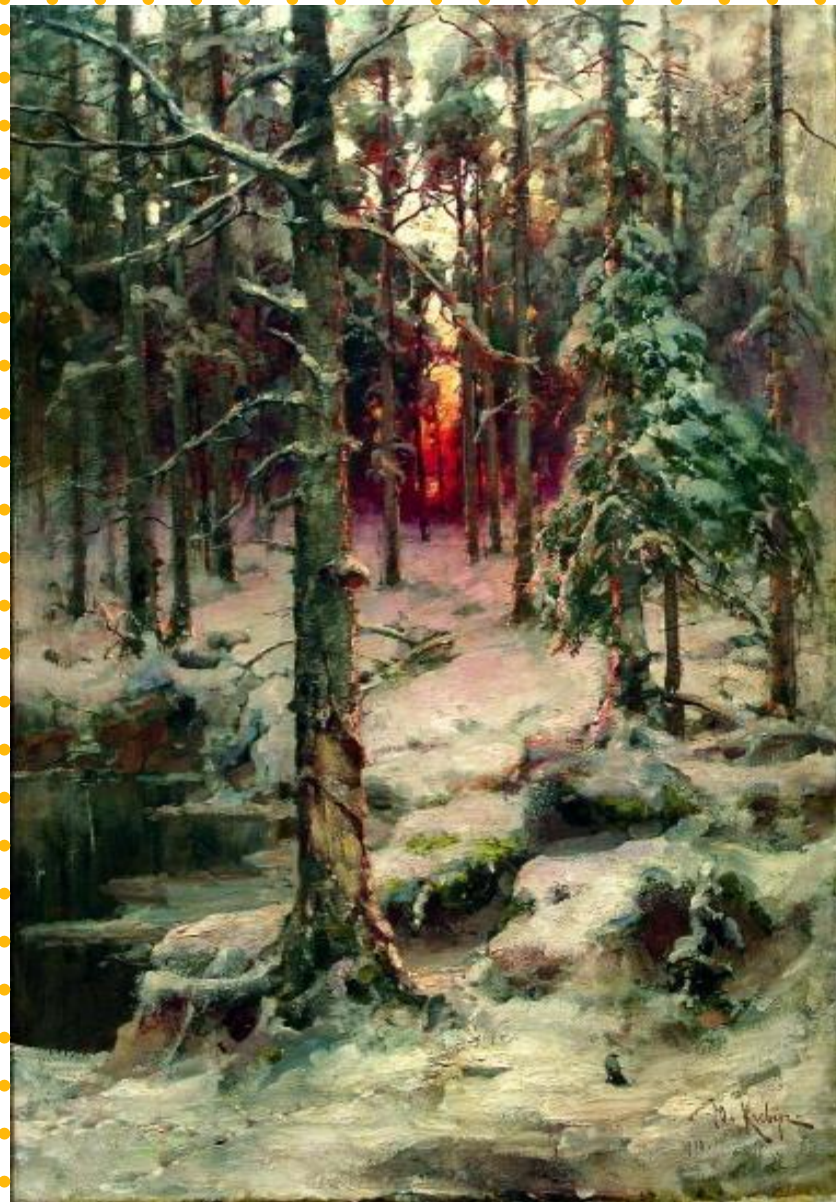
Ю. Клевер. «Зима. Сосновый бор».