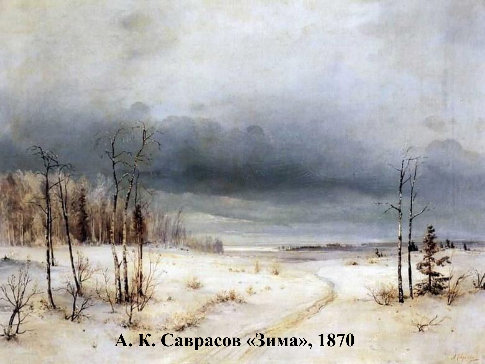
А. К. Саврасов «Зима», 1870