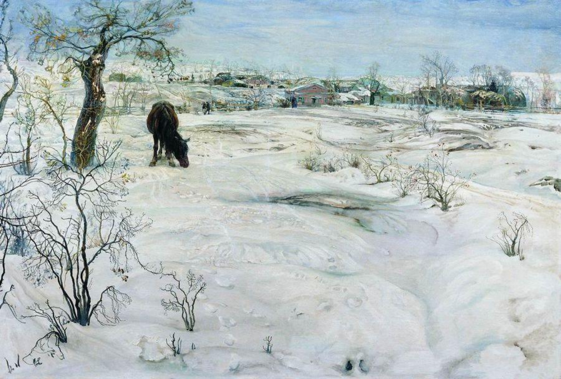
Бродский И. И. Зима