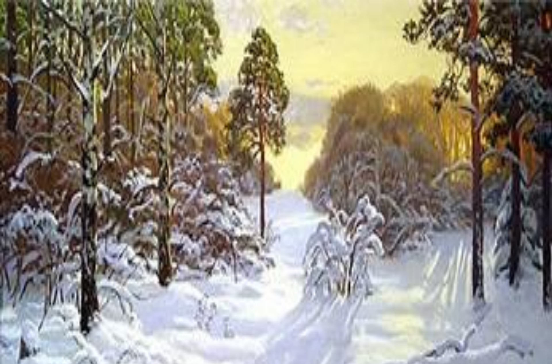
А. Герасимов. «Зимний лес. Просека».