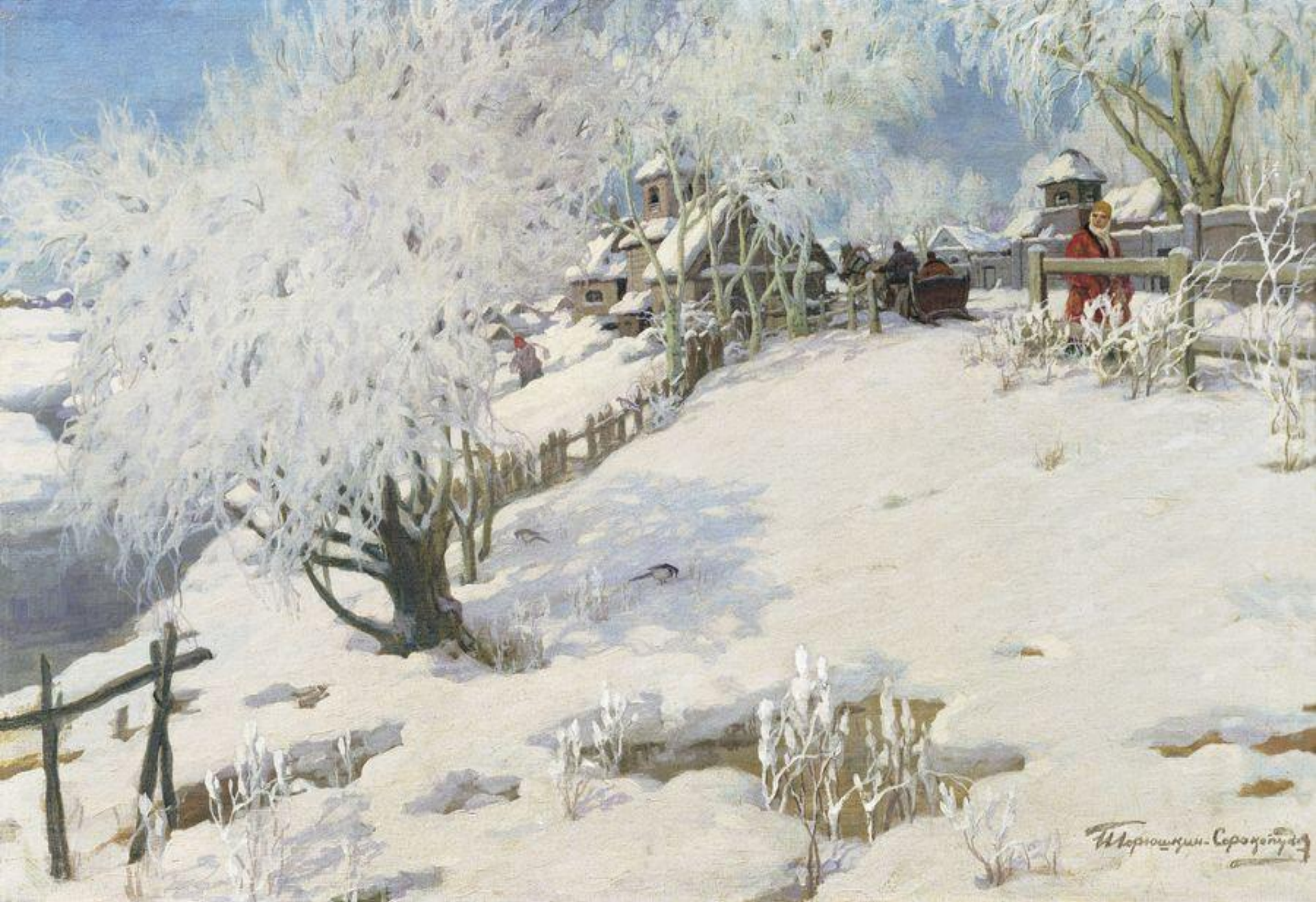
Горюшкин- Сорокопудов И. С. Солнце - на лето, зима - на мороз. 1910