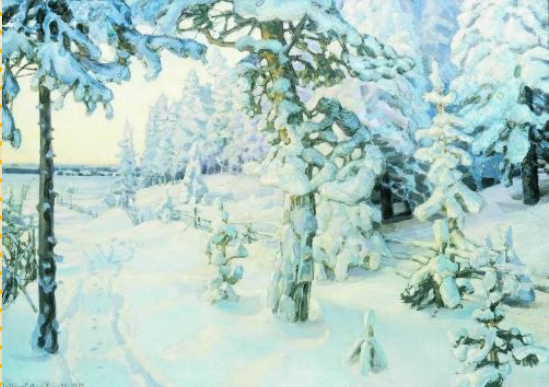
А. Васнецов «Зимний сон (Зима)»