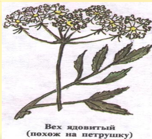
Вех ядовитый (похож на петрушку)