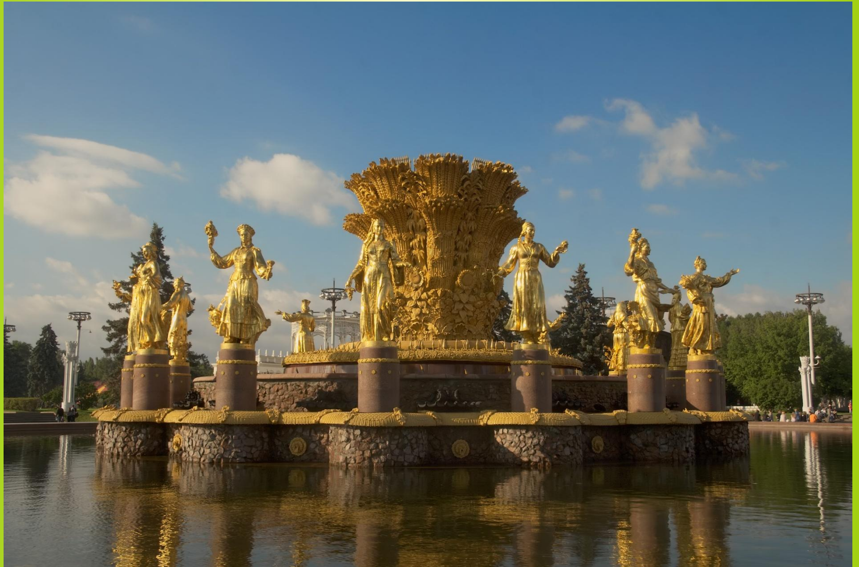
Фонтан Дружбы народов в г. Москва