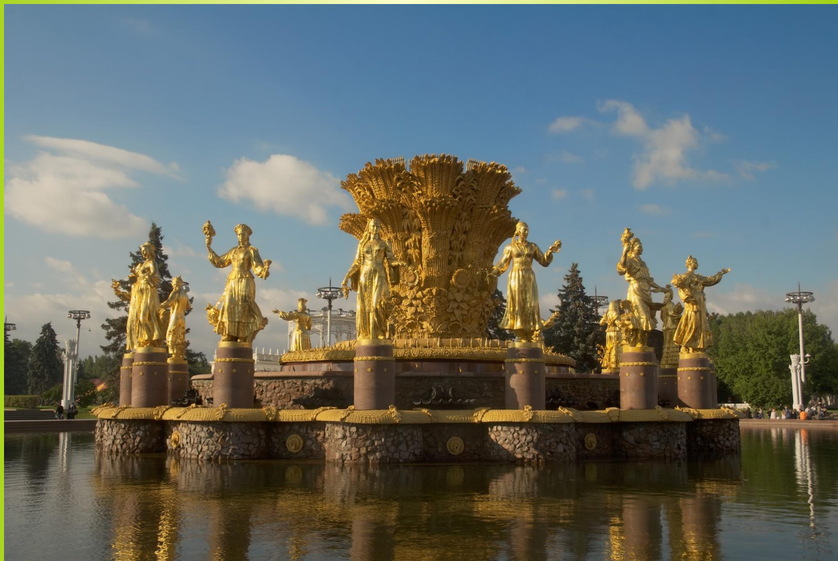
Фонтан Дружбы народов в г. Москва