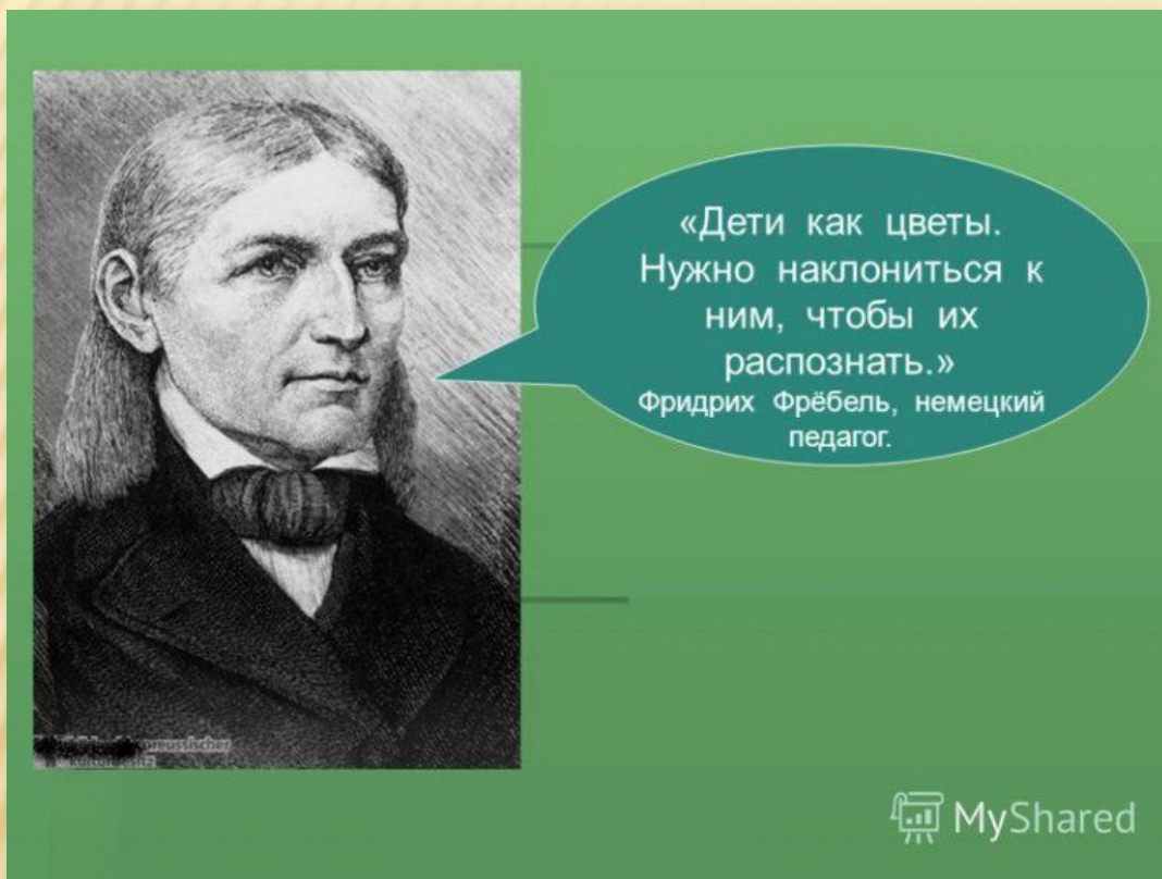
Фридрих Фрëбель (1782-1852)