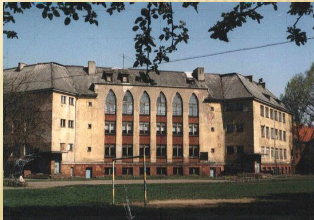
Частный детский сад XIX века