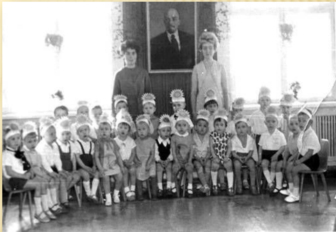
Дошкольное учреждение XX века

ПРОГРАММА ВОСПИТАНИЯ И ОБУЧЕНИЯ В ДЕТСКОМ САДУ