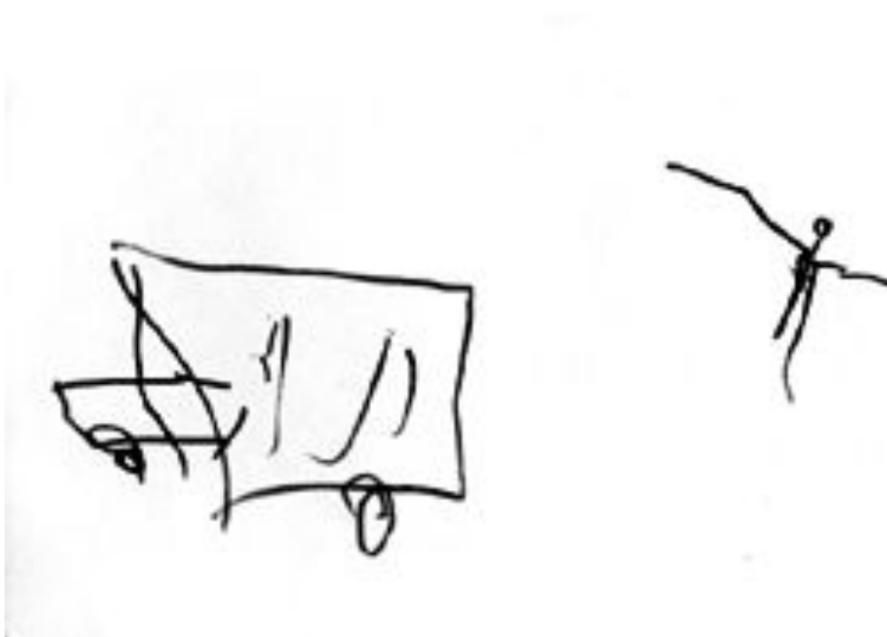
Рис. 4. Сереза, 2 г. 10 мес. Машина и человек