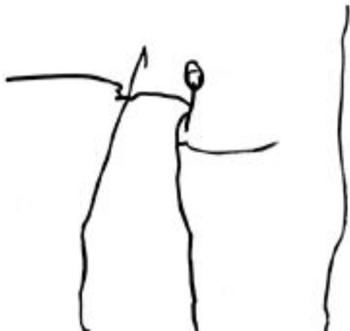
Рис. 3. Сережа, 2 г. 10 мес. Человек (слева) и дерево (справа)