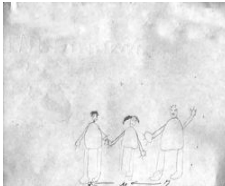
Рис. 10. Женя, 6 лет 2 мес. Рисунок семьи