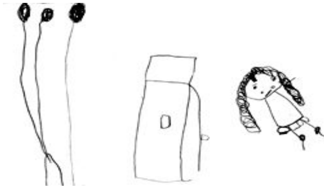
Рис. 7. Анна, 4 г. 10 мес. «Дом — дерево — человек»