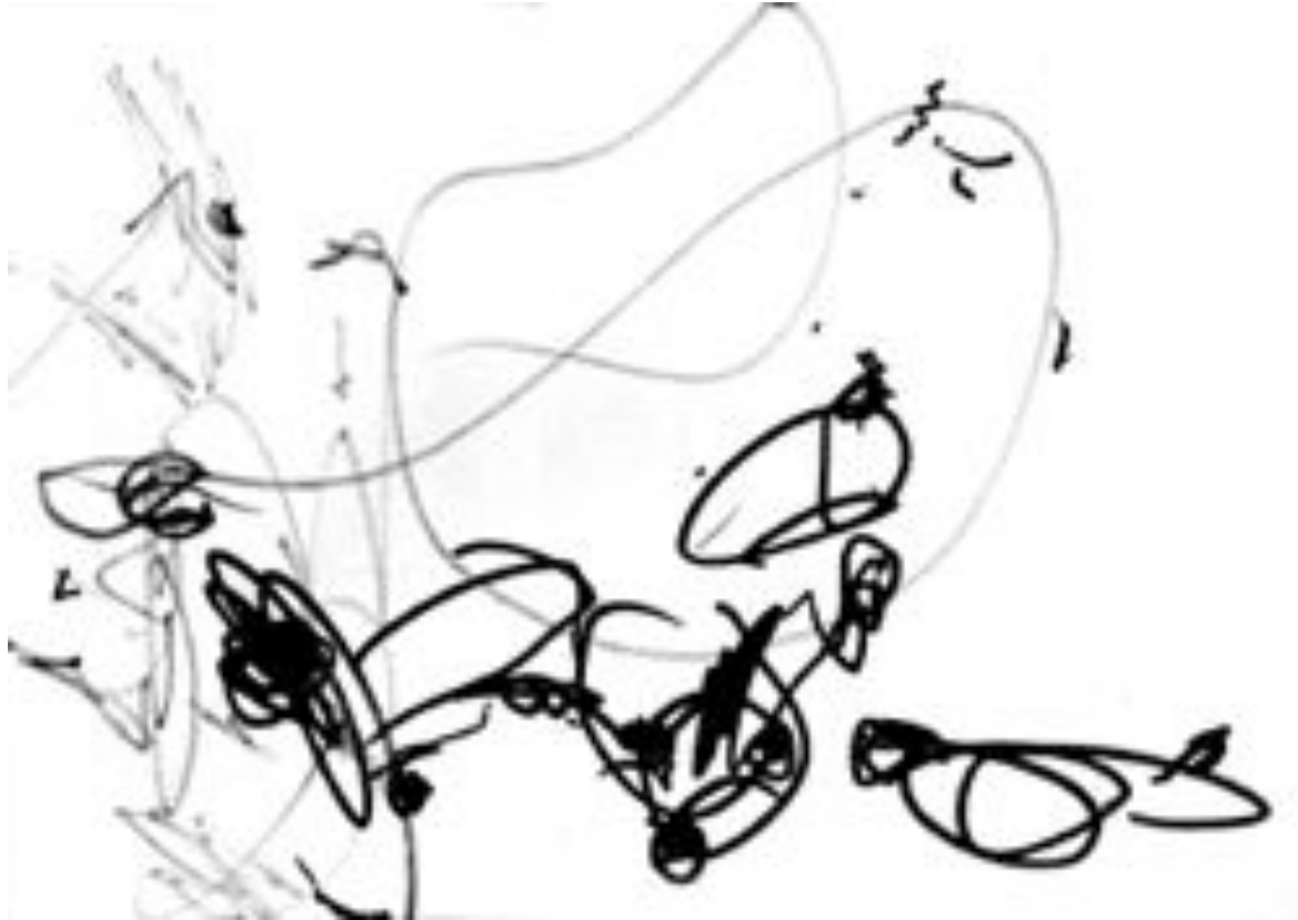
Рис. 1. Катя, 1 г. 9 мес.