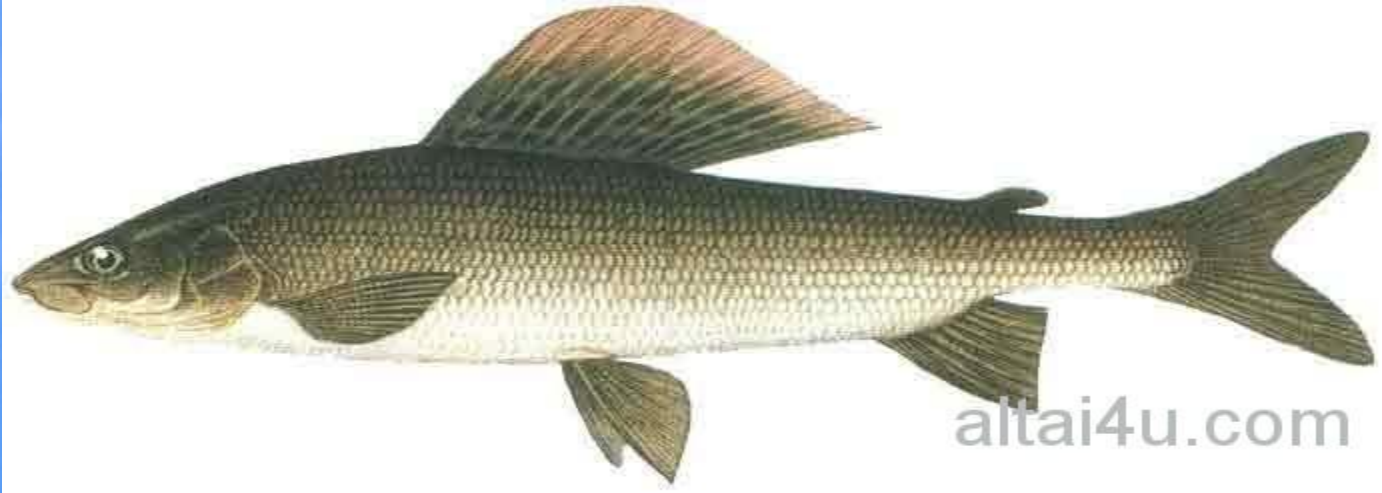
Хариус Размер: 440мм