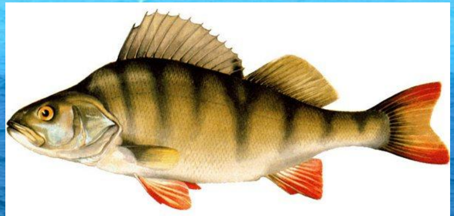
Окунь Размер: 300 мм