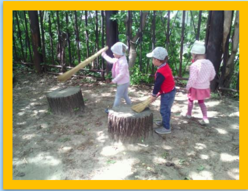
Дети вышли на уборку, Взяли веники, совки, Нужно проявить сноровку, Чтоб быстрее подмести.