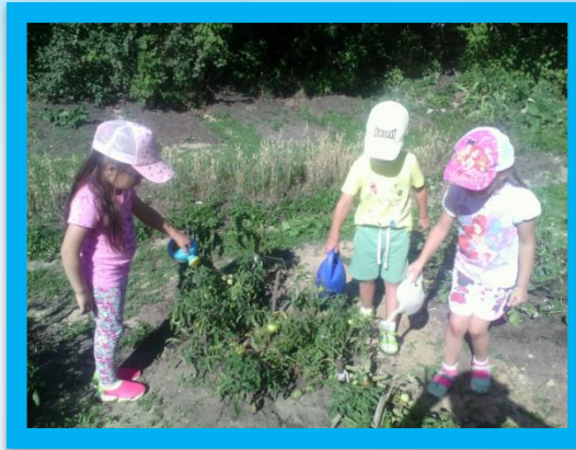
Поливаем с лейки грядки.