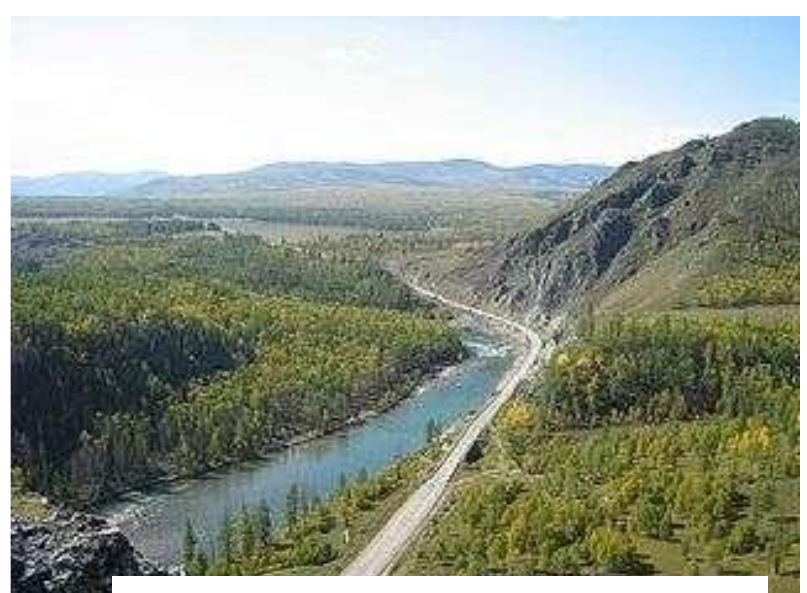
Соргостын Хабсахэй (Юхта)