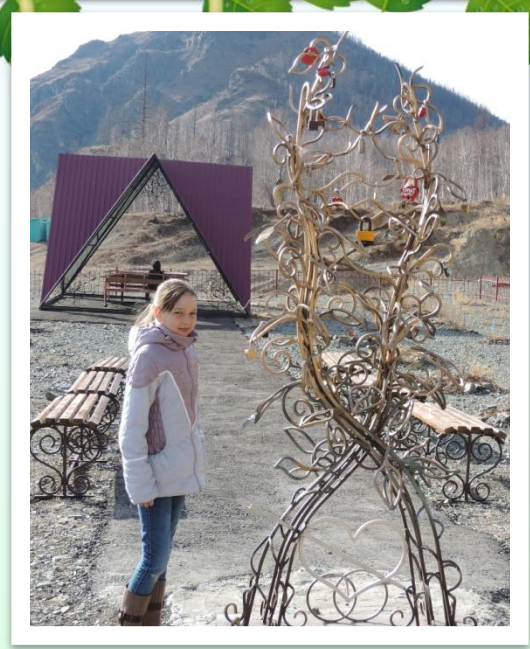
Экскурсия на Юхту.