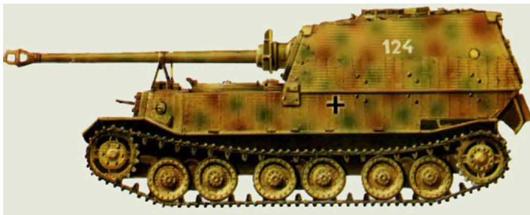
самоходные установки «Элефант»