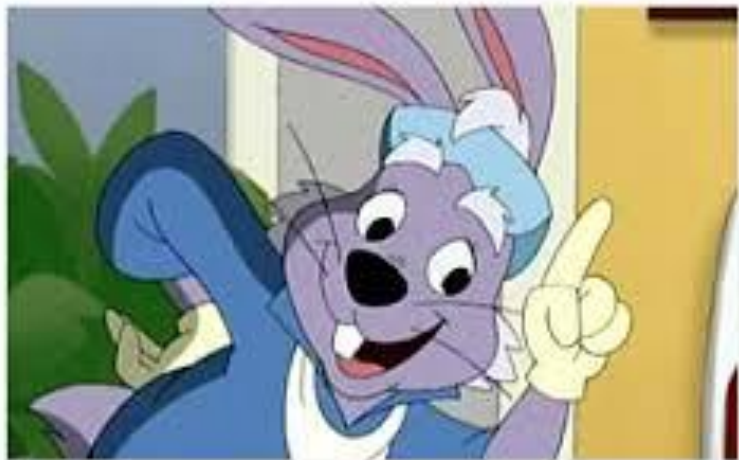
Доктор заяц и легенда о Зубном королевстве