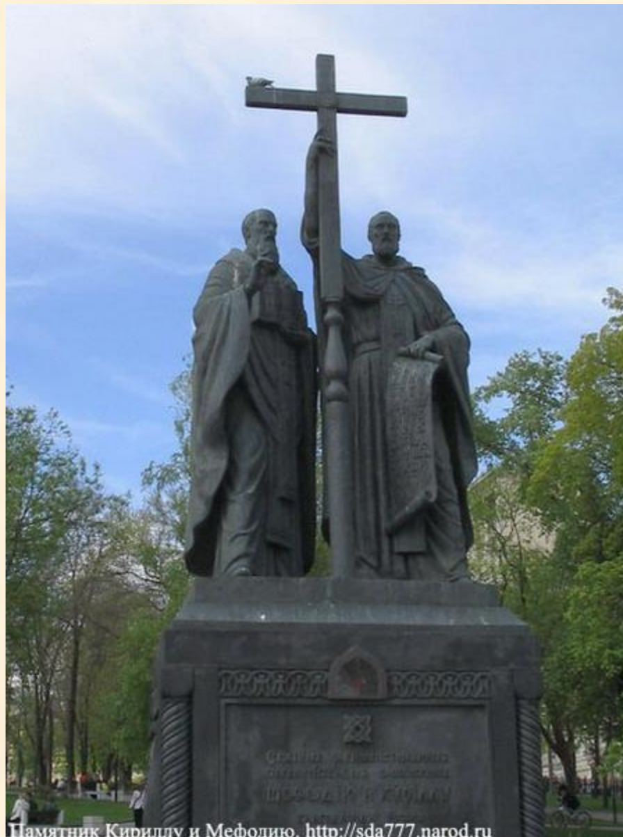
Памятник Кириллу и Мефодию. http://sda777.narod.ru