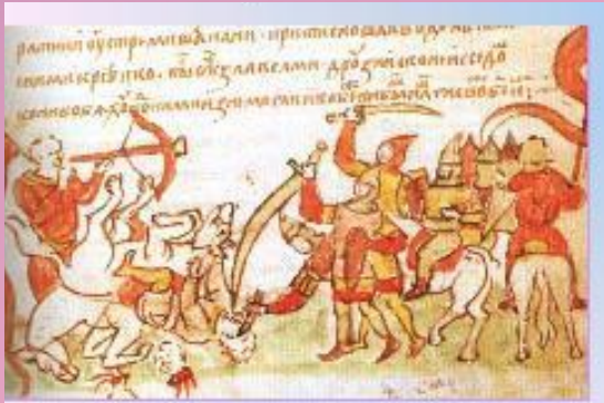
Бой Игоря с половцами 11-12 мая 1185, миниатюра

Ранней весной 1185 года (23 апреля, во вторник) Новгород-Северский князь Игорь Святославович, сын его – Владимир Путивльский, племянник – князь Святослав Ольгович Рыльский вместе с присланными от Ярослава Всеволодовича Черниговского вспомогательными отрядами выступили в далекий поход на половцев. Через неделю Северские полки полностью собрались, и храбрые русичи пошли дальше на юг, чтобы