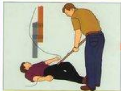
При поражении электрическим током немедленно прекратите его действие