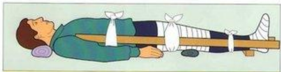
При переломах делайте их иммобилизацию