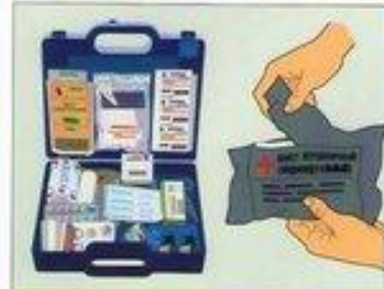
Пользуйтесь индивидуальными аптечками