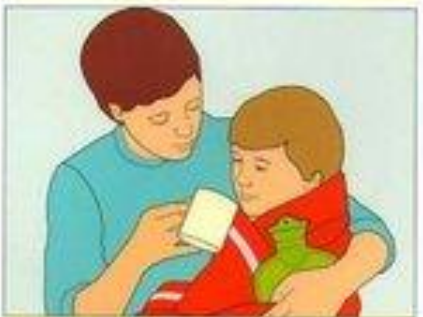
При отморожениях согрейте пострадавшего, дайте горячее питье