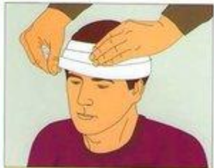
При ранении наложите повязку