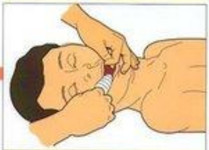
При утоплении очистите полость рта от посторонних предметов