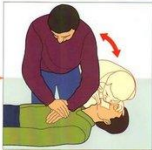
Если необходимы реанимационные мероприятия, сделайте искусственное дыхание и непрямой массаж сердца