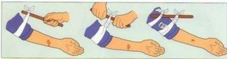
Всеремя остановите кровотечение