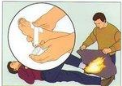
При ожогах поражённый участок обработайте струей холодной воды и наложите стерильную повязку