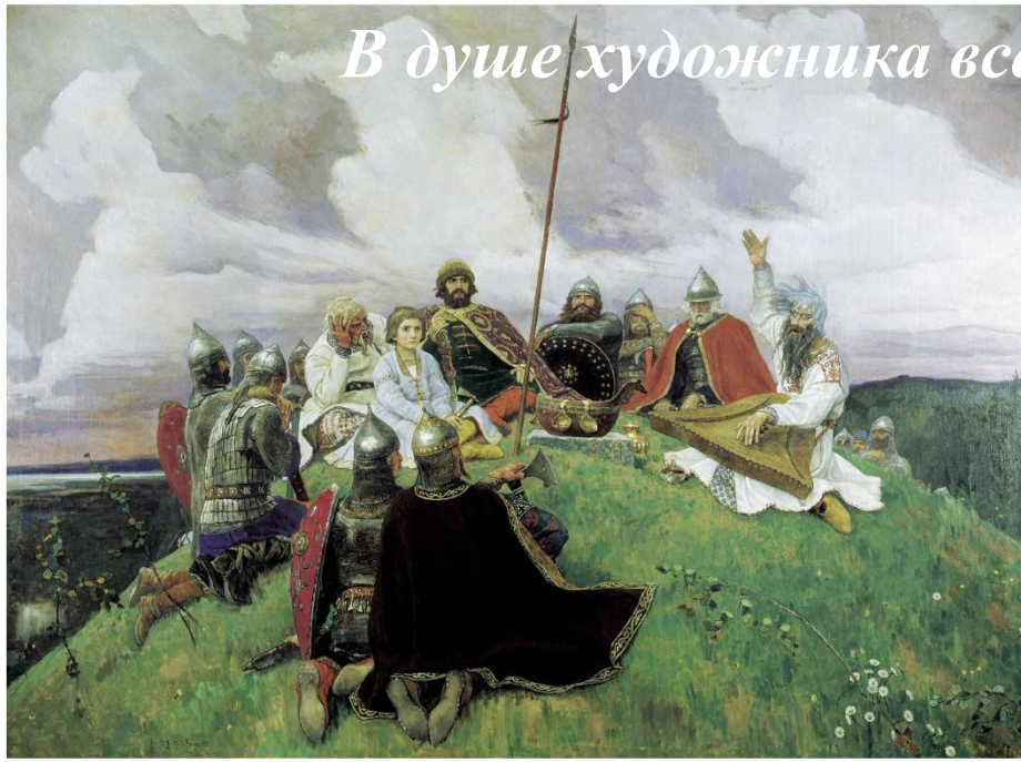
В.М.Васнецов «Баян» 1910г

В душе художника всегда жили образы народного эпоса.