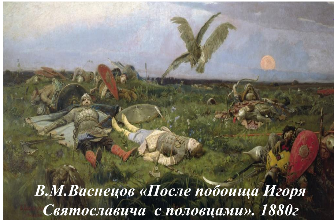
В.М.Васнецов «После побоища Игоря Святославича с половцами». 1880г