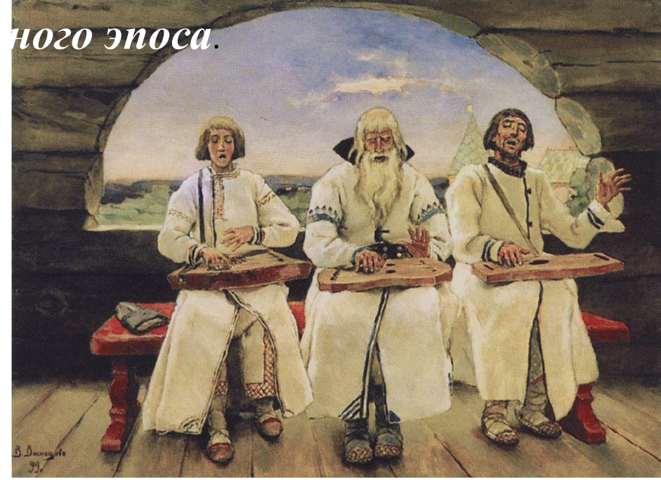
В.М.Васнецов «Гусляры» 1899г