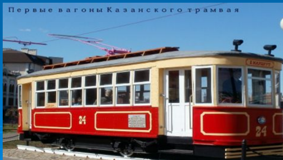
Первые вагоны Казанского трамвая