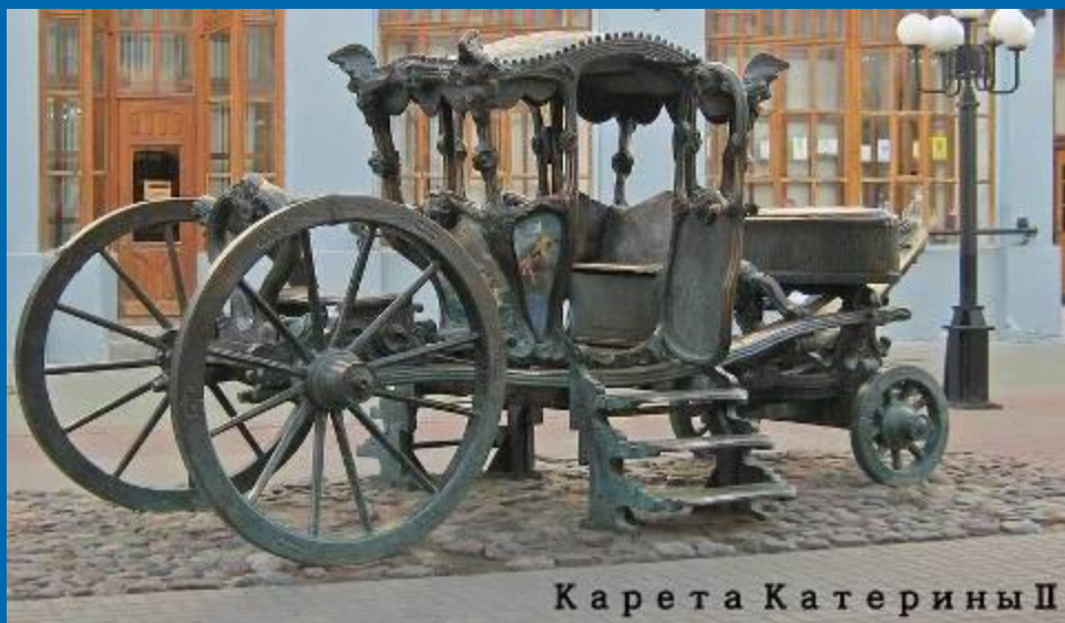
Карета Екатерины II