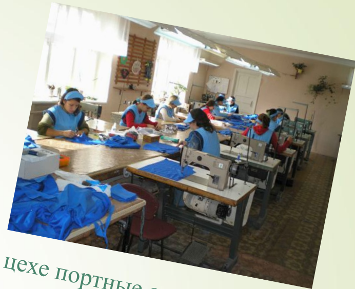
В цехе портные одежду сошьют,