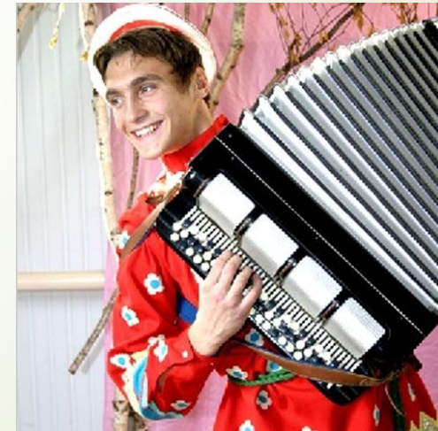
Спляшет на сцене артист под гармонь.