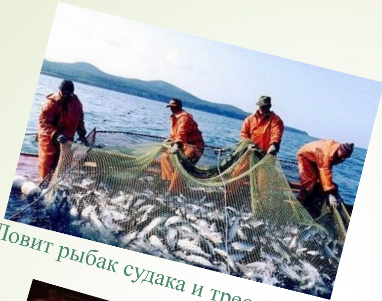
Ловит рыбак судака и треску,