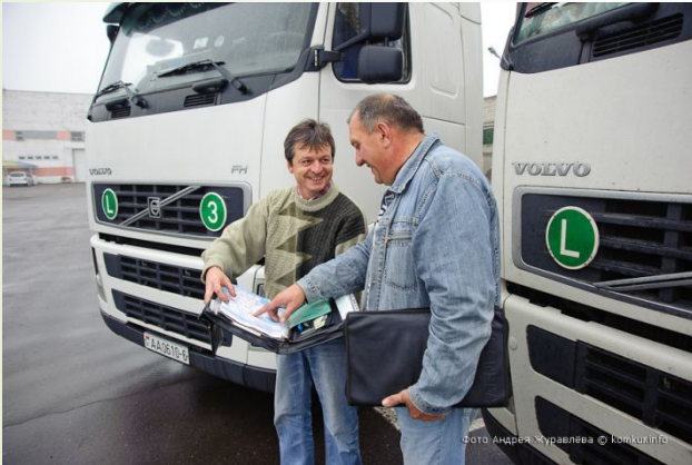
Груз на машине привозит водитель.