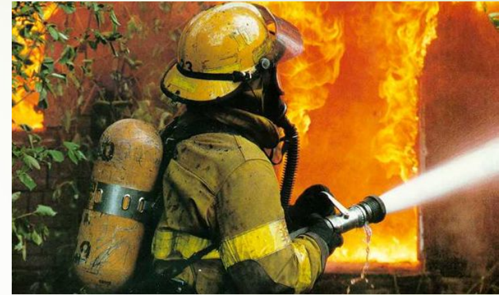
Смелый пожарный потушит огонь,