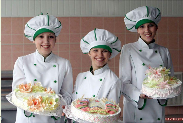
Стряпает торты и кексы кондитер,