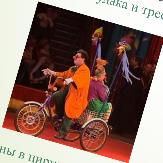
Клоуны в цирке разгонят тоску.