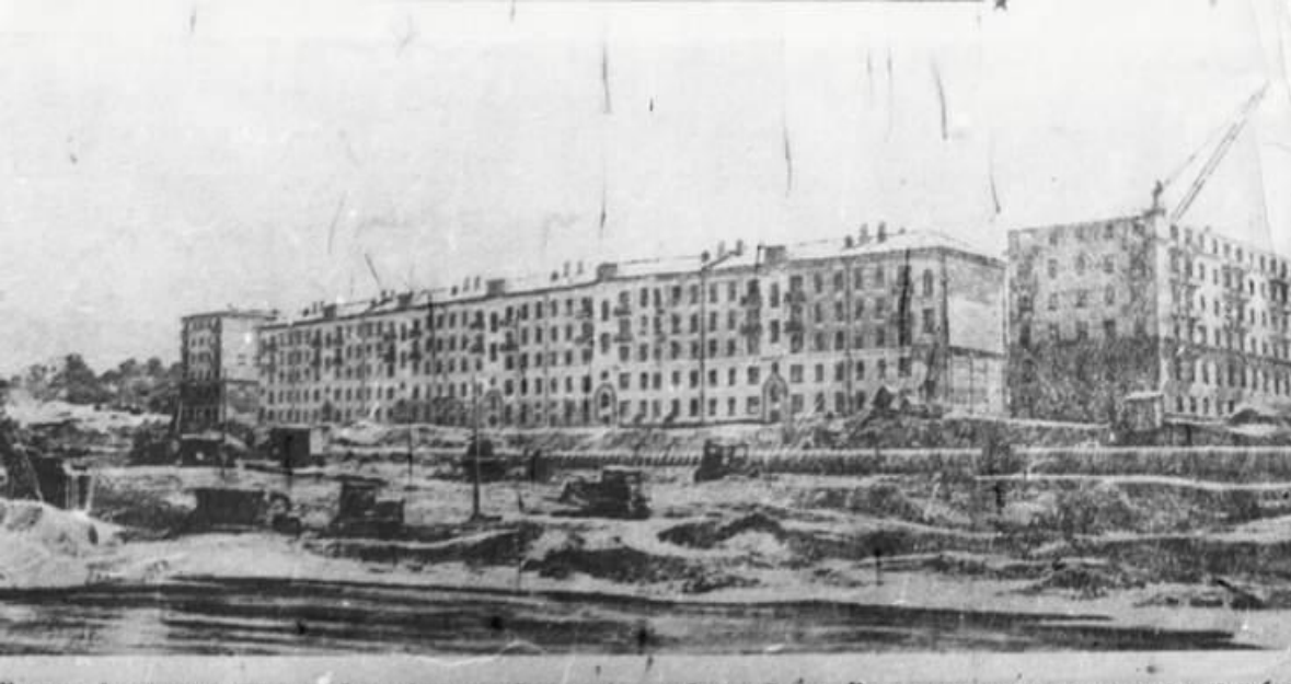
Широким фронтом ведется застройка и благоустройство набережной