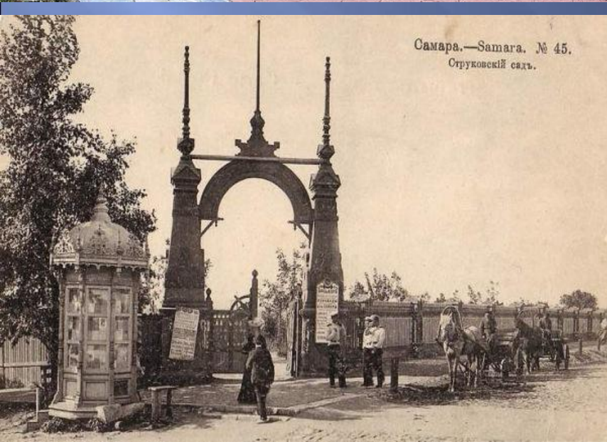
Самара.—Самара. № 45. Струковский сад.