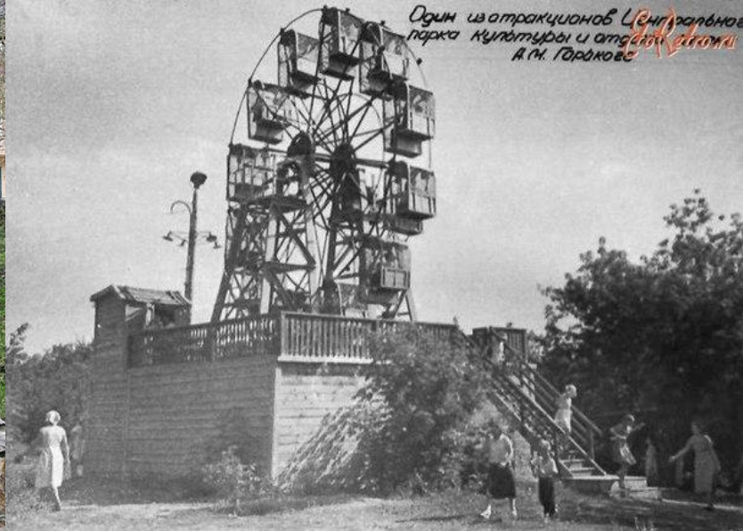
Один из аттракционов Центрального парка культуры и отдыха имени А.М. Горького