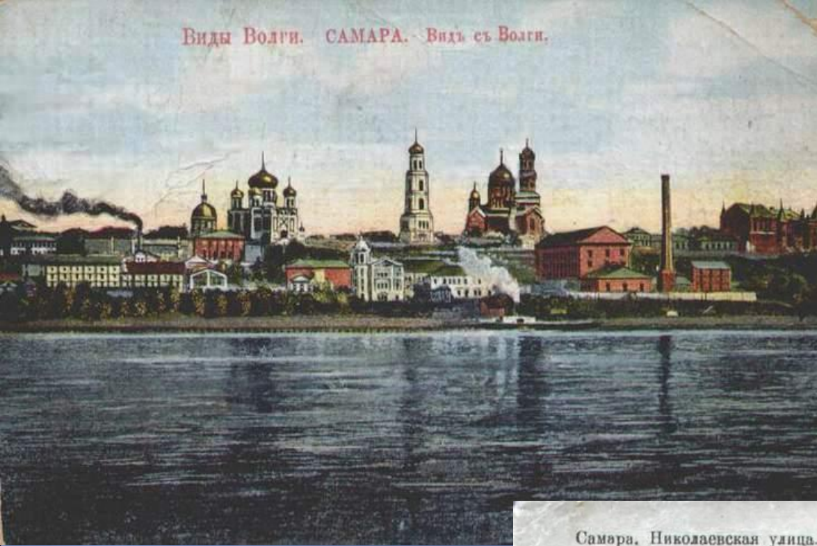
Самара. Николаевская улица.