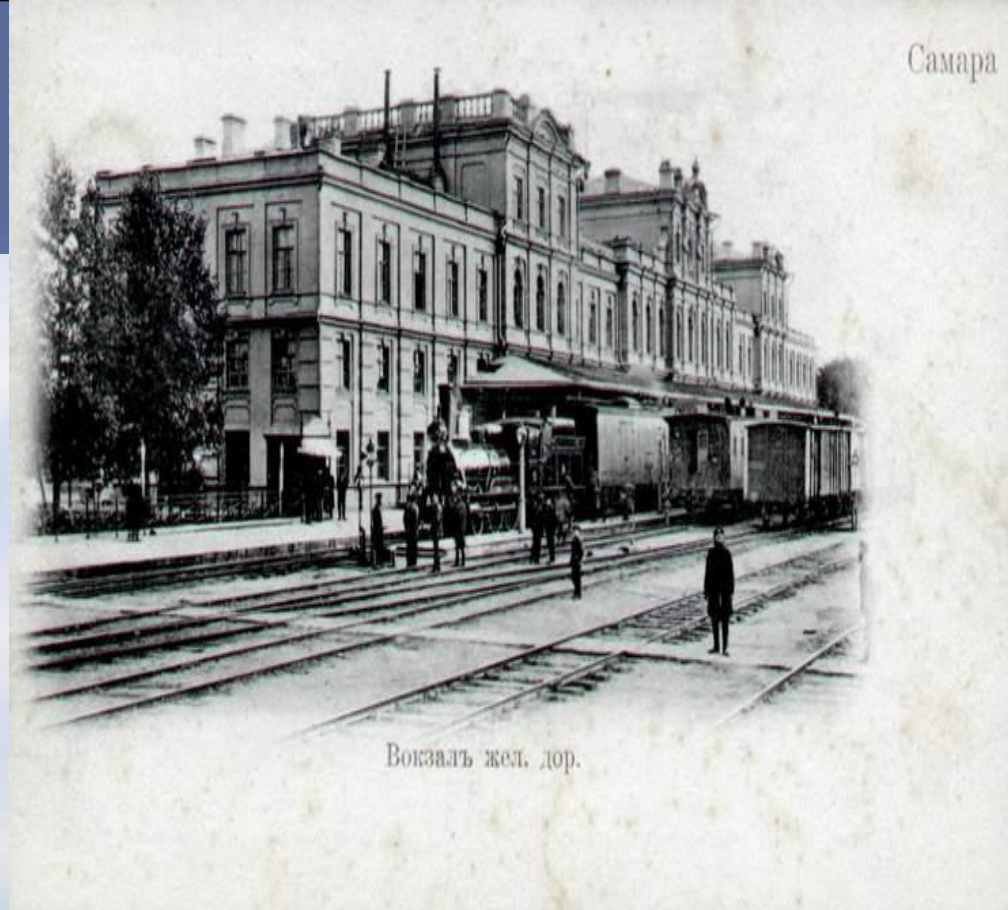
Вокзалъ жел. дор.