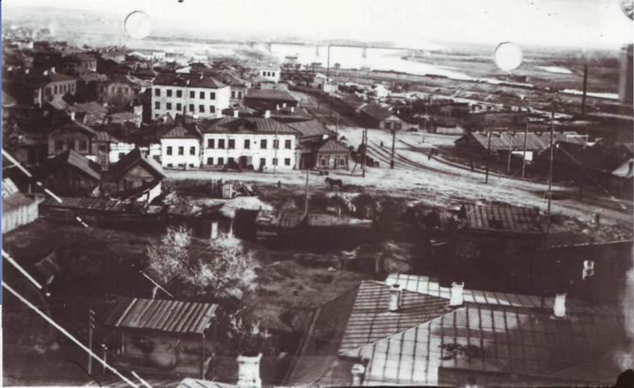
Кит-Траст Самары в районе бухты.