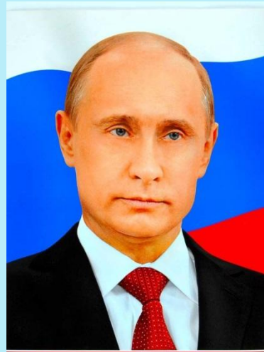
ПРЕЗИДЕНТ РОССИЙСКОЙ ФЕДЕРАЦИИ ПУТИН ВЛАДИМИР ВЛАДИМИРОВИЧ