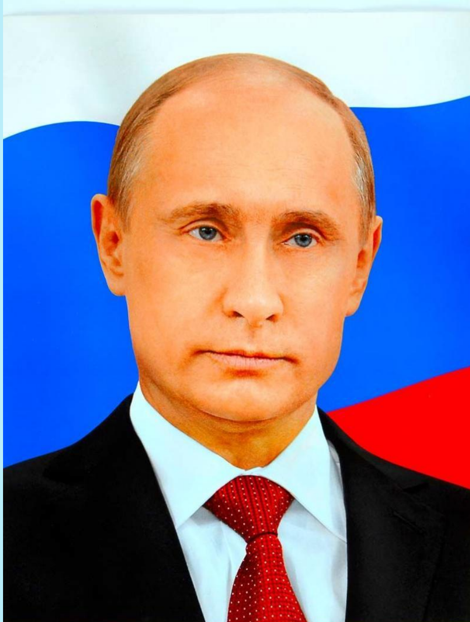
ПРЕЗИДЕНТ РОССИЙСКОЙ ФЕДЕРАЦИИ ПУТИН ВЛАДИМИР ВЛАДИМИРОВИЧ