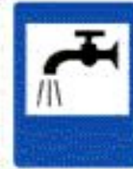
6.8 Питьевая вода