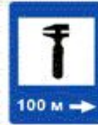
6.4 Техническое обслуживание автомобилей