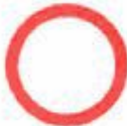
3.2 Движение запрещено