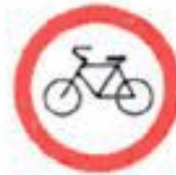
3.9 Движение на велосипедах запрещено