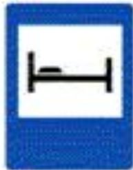
6.9 Гостиница или мотель