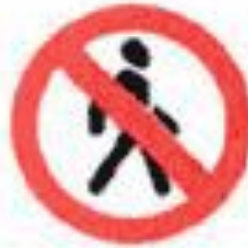
3.10 Движение пешеходов запрещено