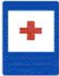
6.1 Пункт первой медицинской помощи