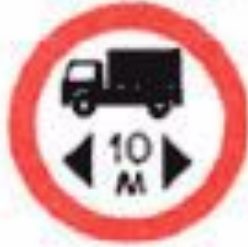
3.15 Ограничение длины