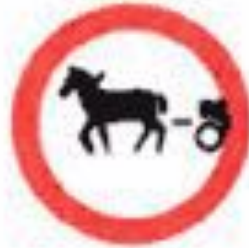
3.8 Движение гужевых повозок запрещено