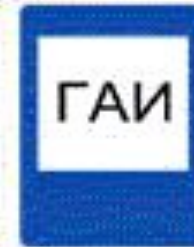
6.12 Пост ГАИ