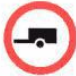
3.7 Движение с прицепом запрещено