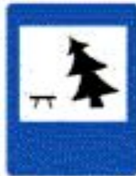
6.11 Место отдыха