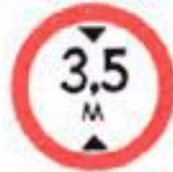
3.13 Ограничение высоты