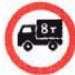
3.4 Движение грузовых автомобилей запрещено