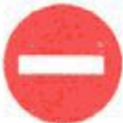
3.1 Въезд запрещен