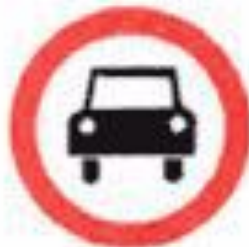
3.3 Движение механических транспортных средств запрещено