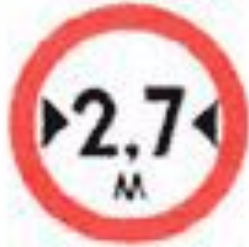
3.14 Ограничение ширины