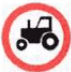
3.6 Движение тракторов запрещено