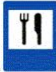
6.7 Пункт питания