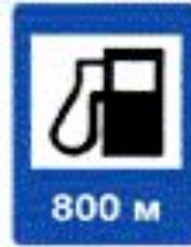
6.3 Автозаправочная станция