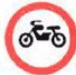
3.5 Движение мотоциклов запрещено