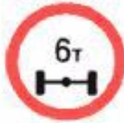
3.12 Ограничение массы, приходящейся на ось транспортного средства