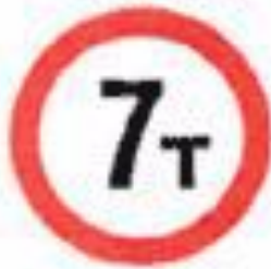
3.11 Ограничение массы