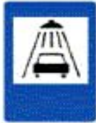
6.5 Мойка автомобилей